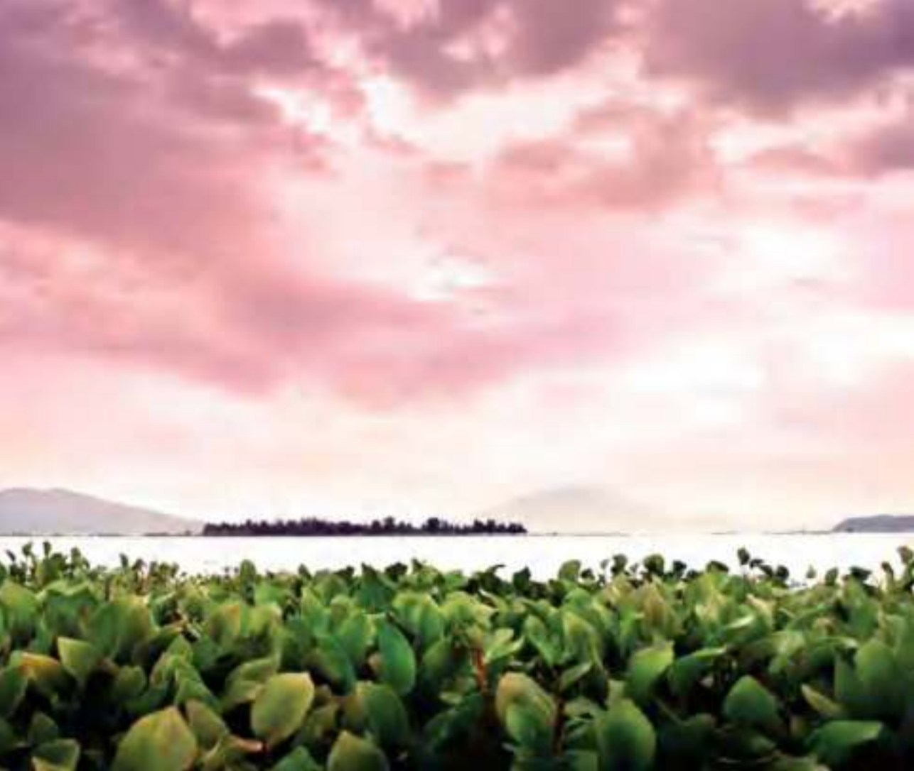
Lirio acuático, en la laguna de Yuriria.