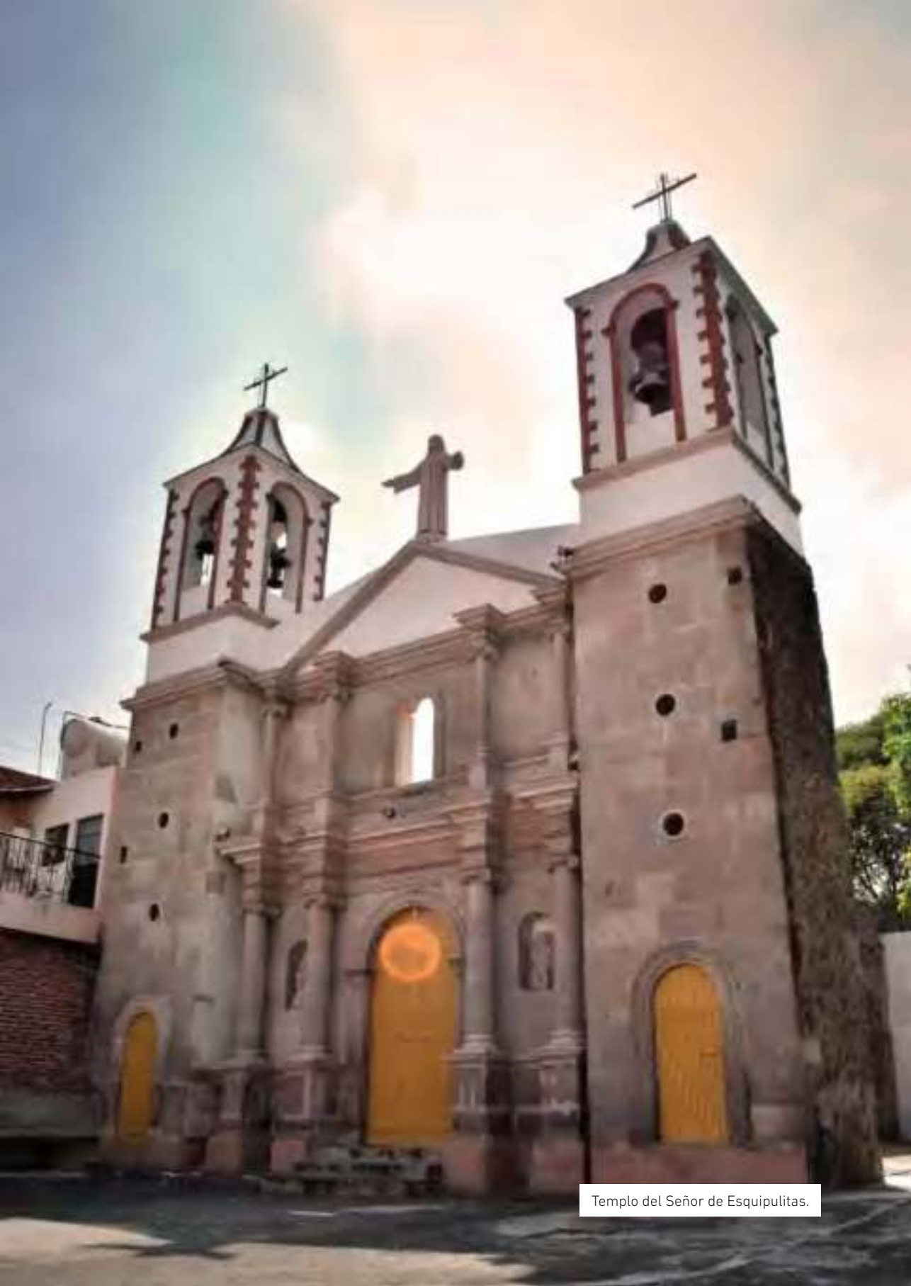
Templo del Señor de Esquipulitas.