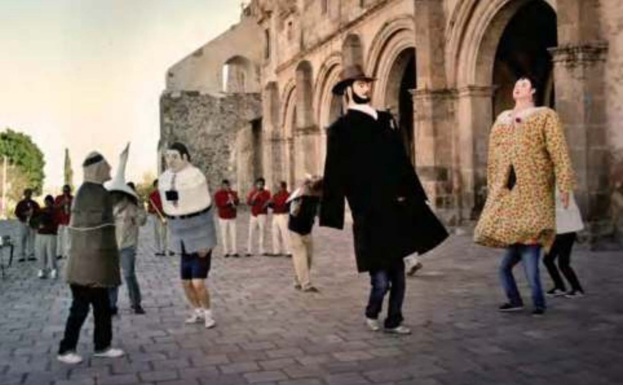
Celebración con mojigangas.