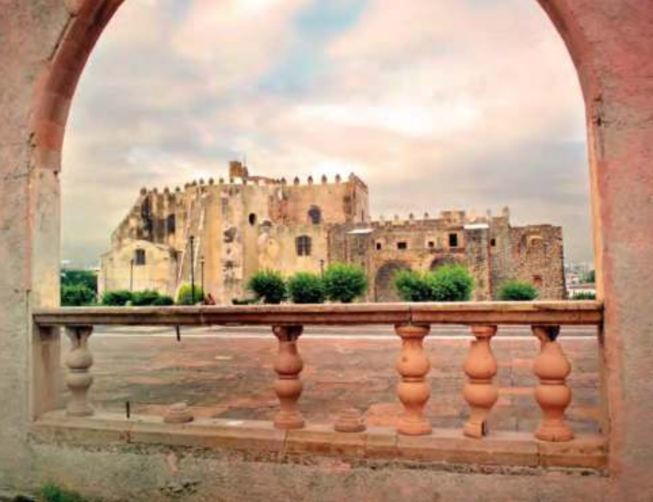
Convento y templo agustinos, imagen emblemática de la ciudad de Yuriria.

de reminiscencia ojival con un original trazo geométrico, en una mezcla de elementos renacentistas y ojivales.