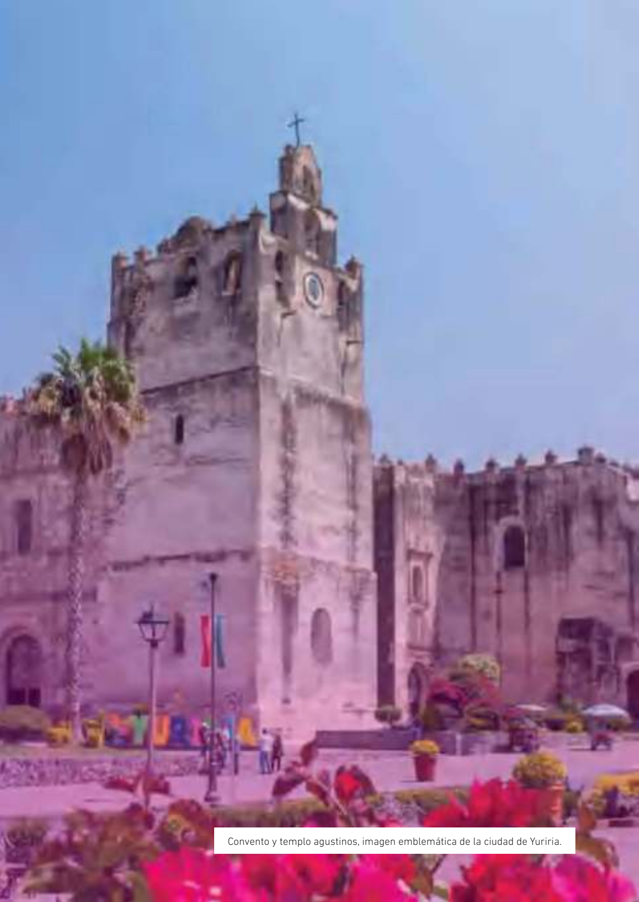
Convento y templo agustinos, imagen emblemática de la ciudad de Yuriria.