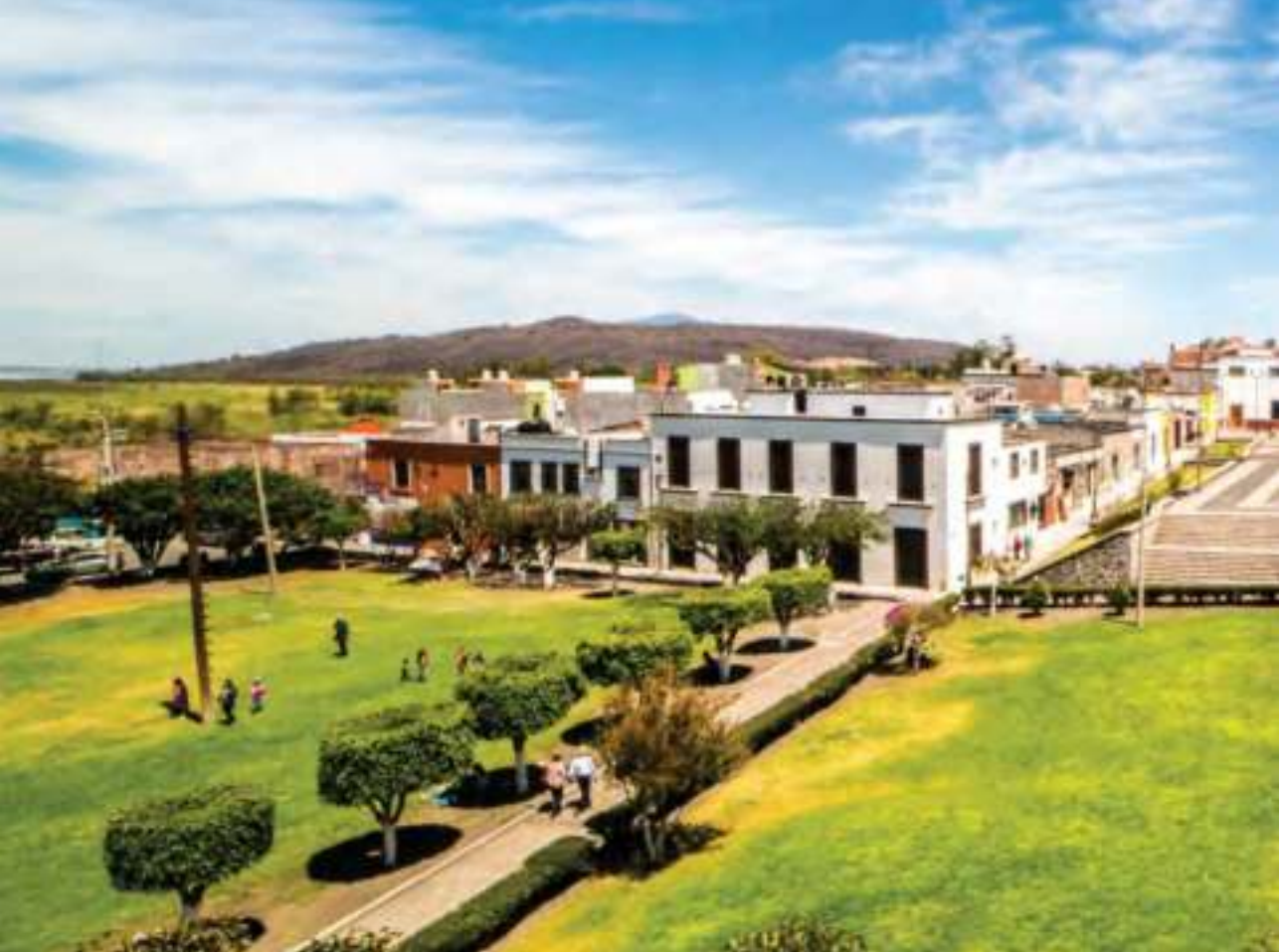
Vista general del Jardín Principal.