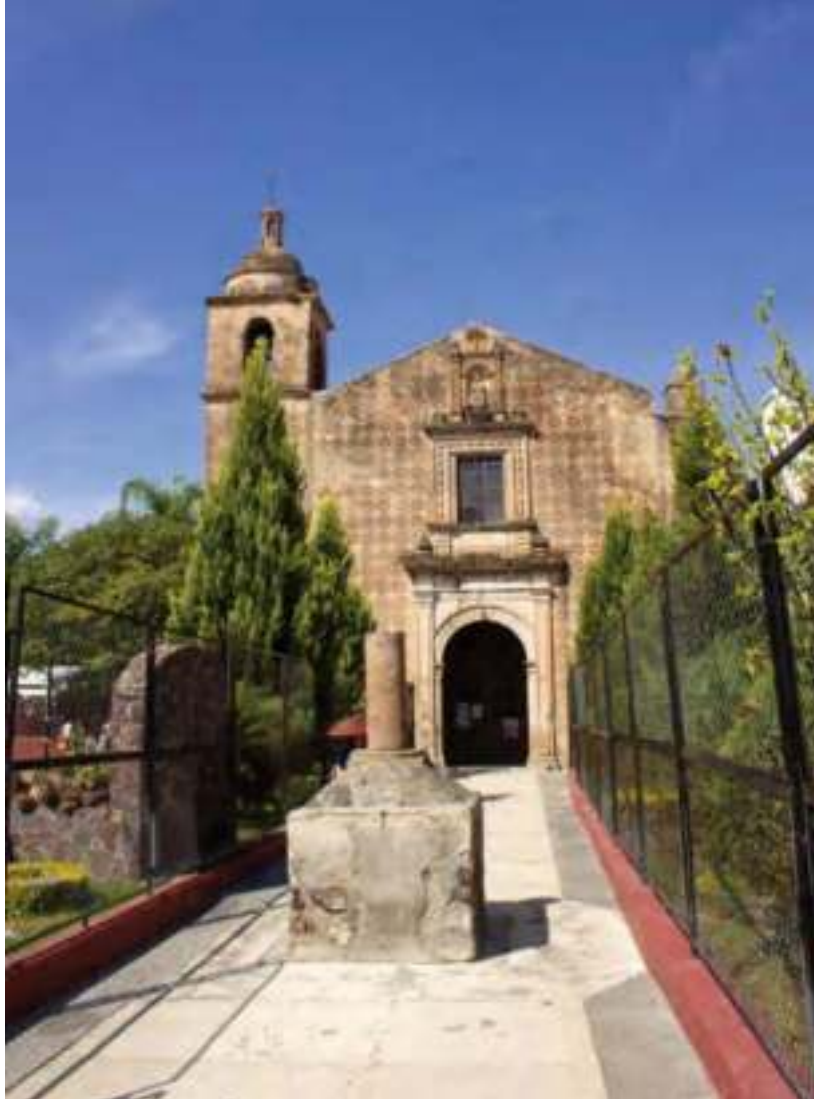
Templo del hospital, uno de los más antiguos de la ciudad.