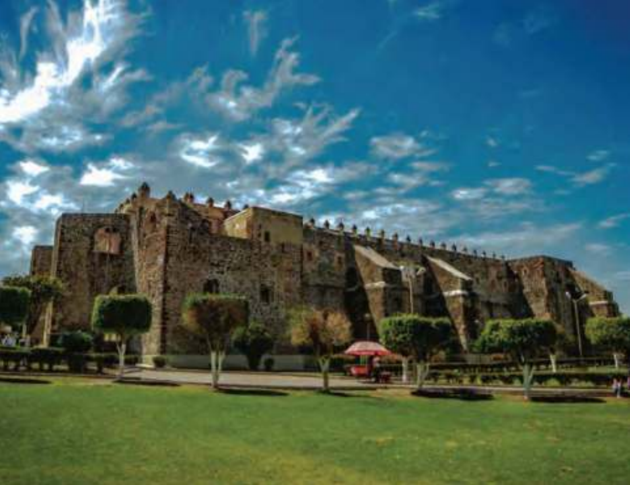
Impresionante vista del exterior del exconvento agustino.

representaciones de las figuras que acompañan a los evangelistas: toro, águila, león y ángel.