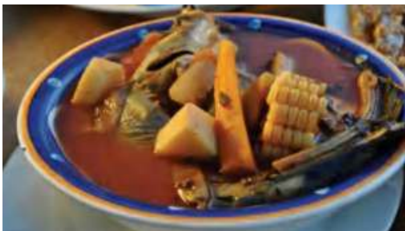
El caldo michi de Yuriria, un clásico del sur del estado.

En cuanto a la cocina tradicional, se puede degustar la raíz de cerro, que es un tipo de camote silvestre que se sirve como botana; también el colinabo con limón, sal y chile, una planta hortícola y forrajera que parece un nabo de bulbo redondo y carnoso, y tiene un tallo alargado. Es morado o blanco.