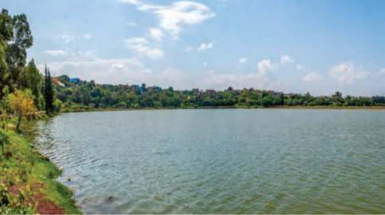
Visión panorámica del enigmático lago-cráter La Joya.

Esta zona cuenta con un tipo de vegetación de selva baja caducifolia en los taludes al sur del cráter y en las montañas ubicadas en la parte sur del Área Natural Protegida. Por la composición vegetal y la diversidad de especies que se desarrollan en esta área, se contribuye al desarrollo de insectos benéficos para la polinización de plantas silvestres y cultivadas.