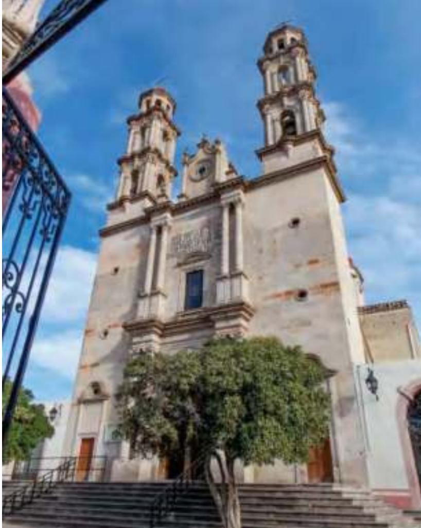
Templo del Señor de la Preciosa Sangre de Cristo.

La iglesia tiene diversas fiestas: el 1 de enero, una gran celebración con danzas; el 4 de enero, la fiesta principal del pueblo; el 1 de julio, se pide por el buen temporal, por las buenas cosechas y por las lluvias; el 31 de agosto, la imagen es bajada y se lleva hasta la parroquia de la ciudad, en medio de casas decoradas con colores rojo y blanco; y en septiembre, se agradece el buen temporal con ofrendas de mazorcas de maíz, calabazas y otros productos.