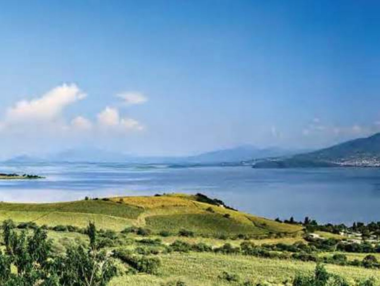
Vista panorámica de la laguna de Yuriria.