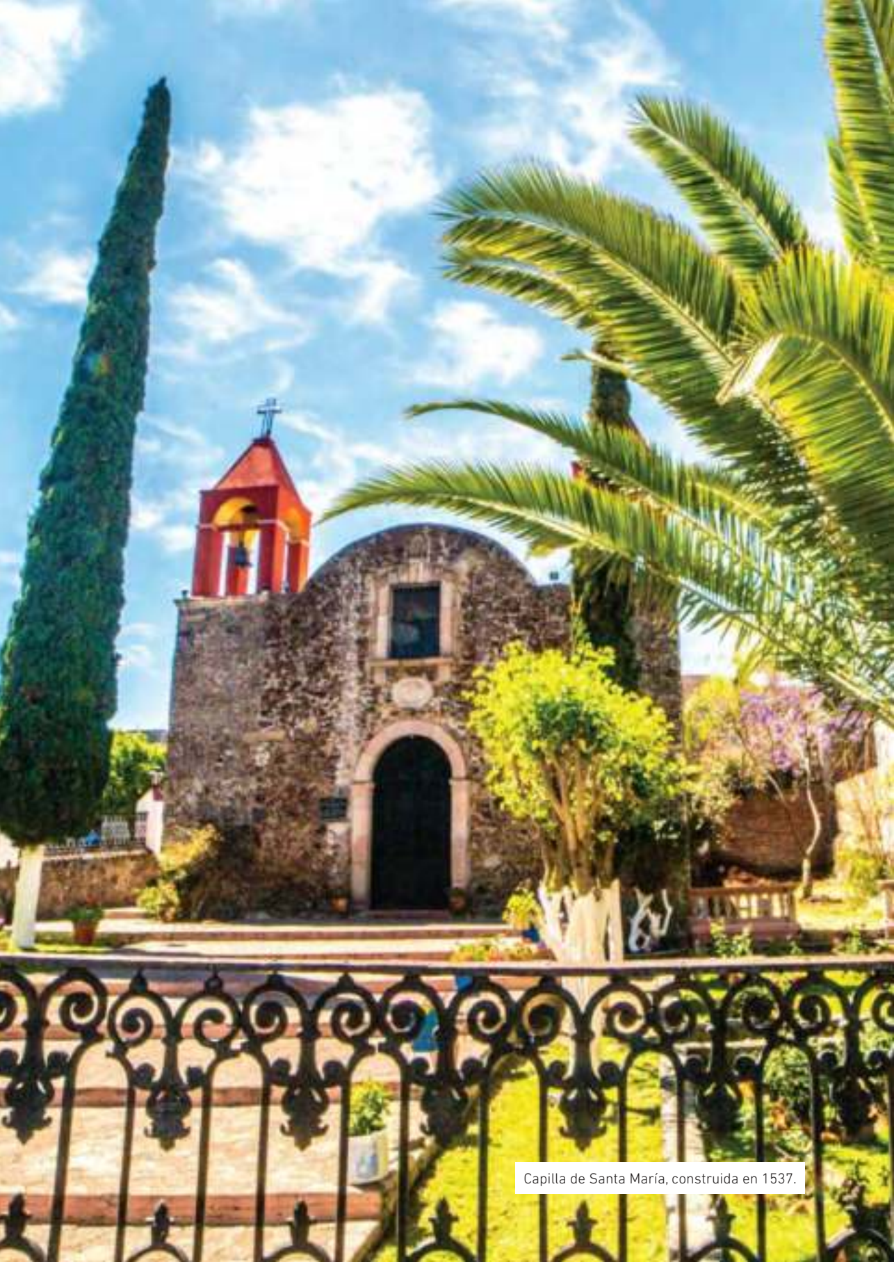
Capilla de Santa María, construida en 1537.