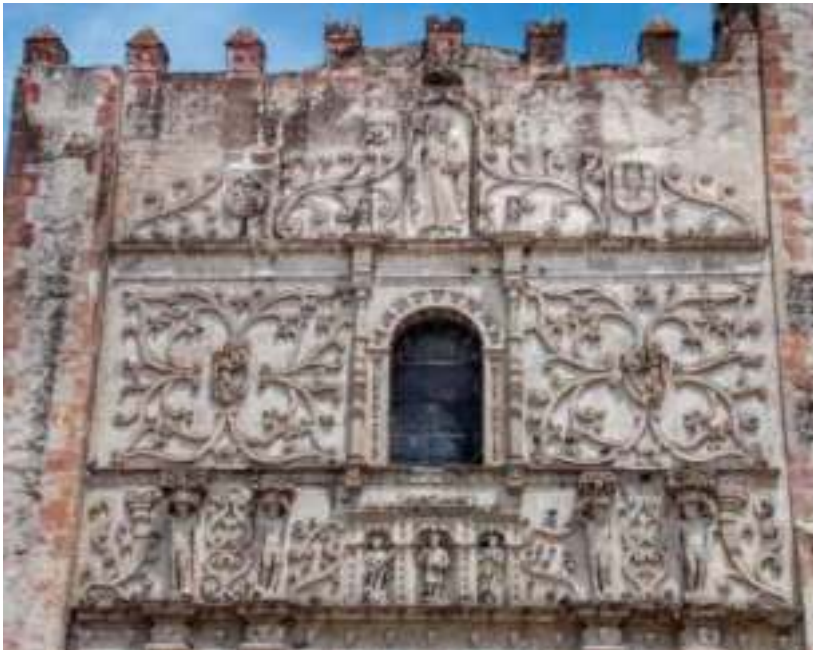
Fachada del exconvento de Yuriria.

Recinto agustino proyectado por el arquitecto Pedro del Toro, que inició su construcción en 1550 por encargo de fray Diego de