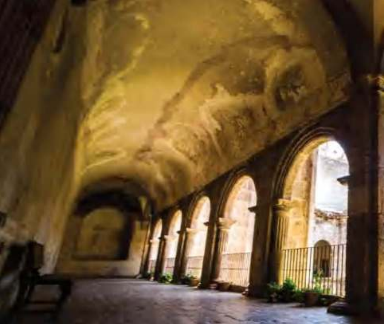
Corredores que daban acceso a las celdas.