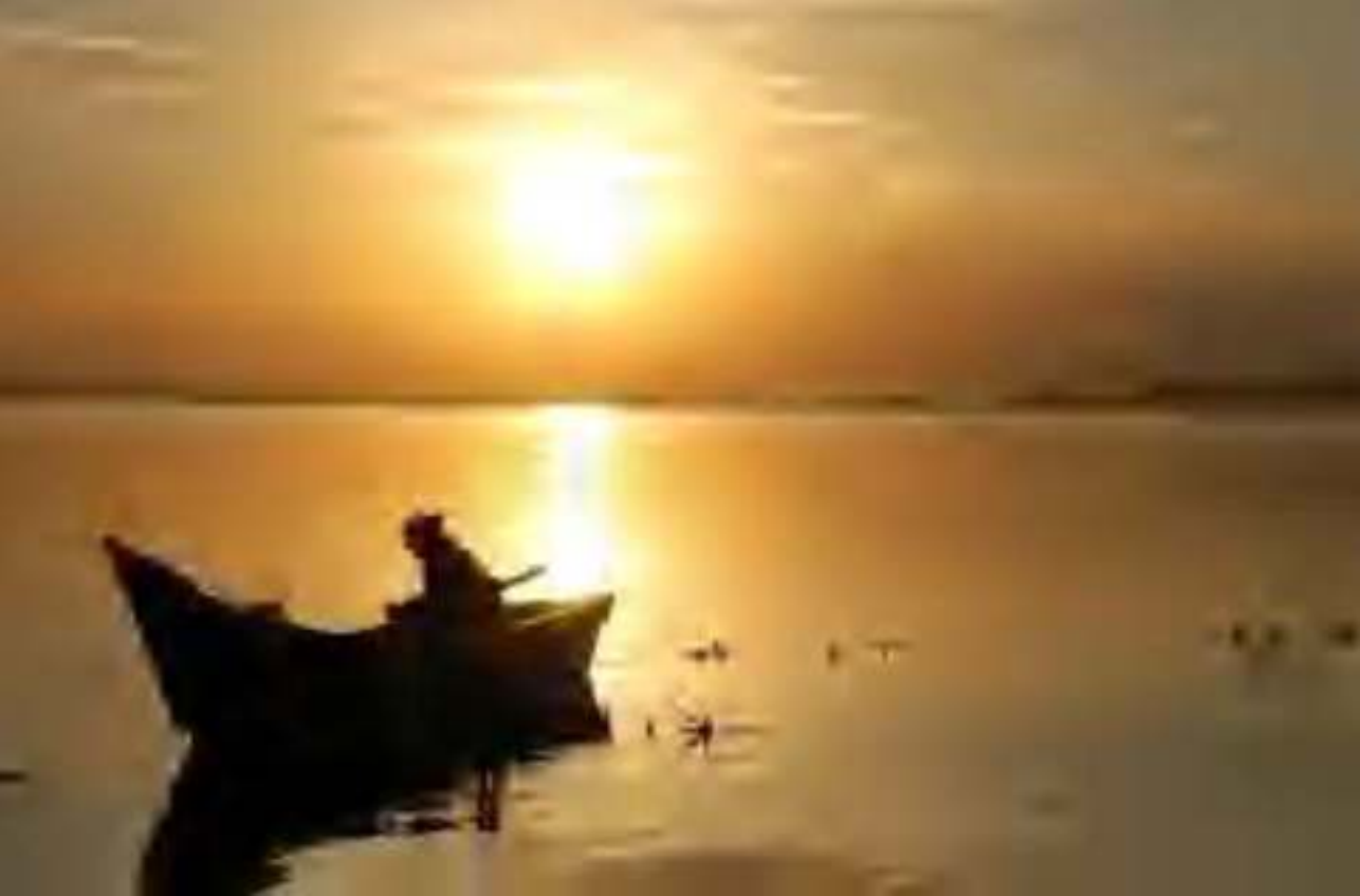
Vista de la laguna de Yuriria.

como vicario en Cañada de Caracheo, Cortazar, donde terminó la construcción de su templo. Fue asesinado en 1928 durante la Guerra Cristera y el papa Juan Pablo II lo beatificó, el 10 de octubre de 1997. Sus restos se veneran en la iglesia parroquial de Cañada de Caracheo.