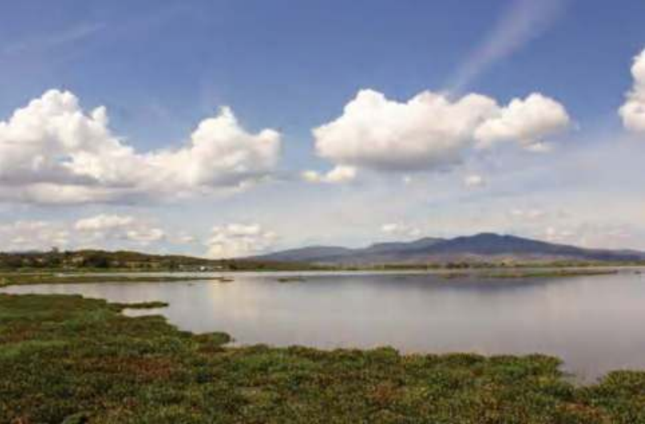
La laguna de Yuriria.

subacuáticas típicas de un humedal como tule, nenúfar, papiro, carrizo, pelusa, lenteja de agua, lechuguilla y lirio acuático.