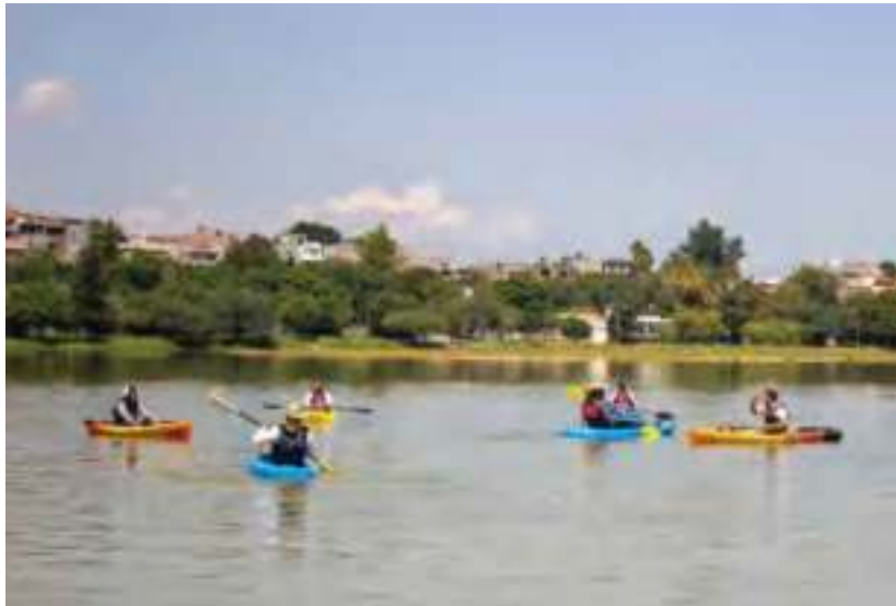
Práctica de kayak.

Los tipos de vegetación predominantes son matorral subtropical, matorral espinoso y pastizal, además de especies