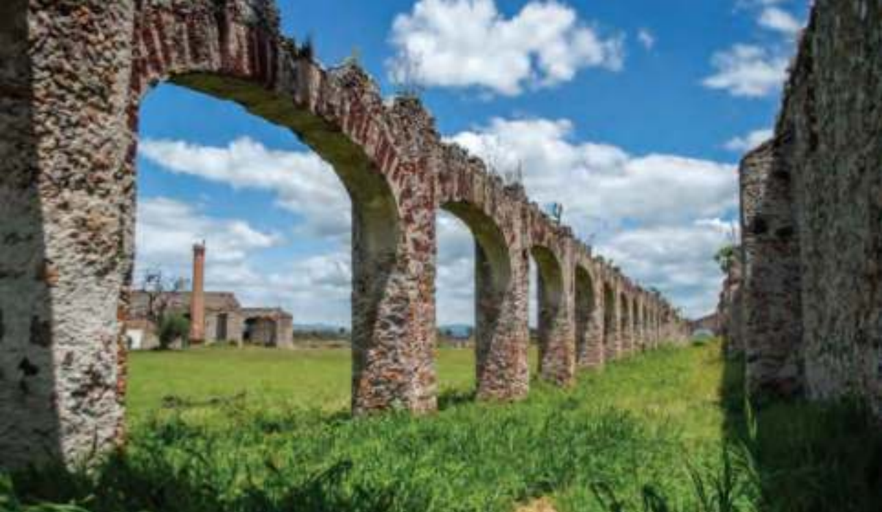
Arquería de la exhacienda de San José del Carmen.

Inmueble Patrimonial por el Instituto Nacional de Antropología e Historia (INAH), que data del siglo xvii.