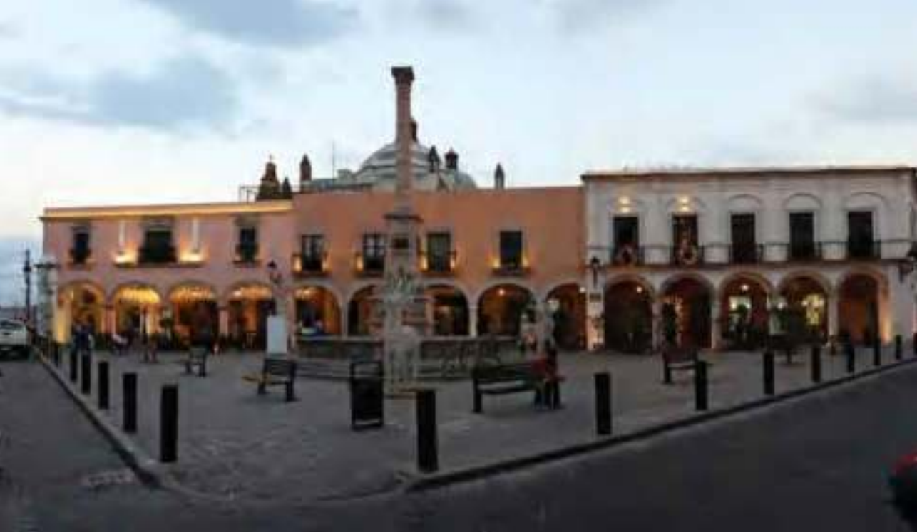
Fuente de los Perros.

con dos pisos estilo neoclásico y está rematado con el águila del escudo nacional.