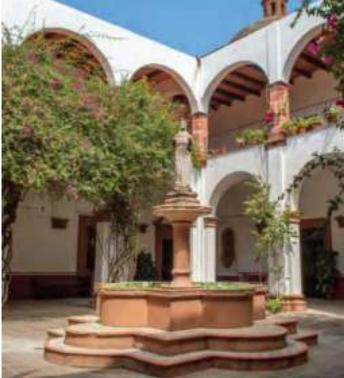
Patio del convento de San Francisco.

Es una de las edificaciones más significativas de Salvatierra, ya que fue su primera parroquia, cuya construcción fue concluida en el siglo xvii, y el templo cerca de 1720.