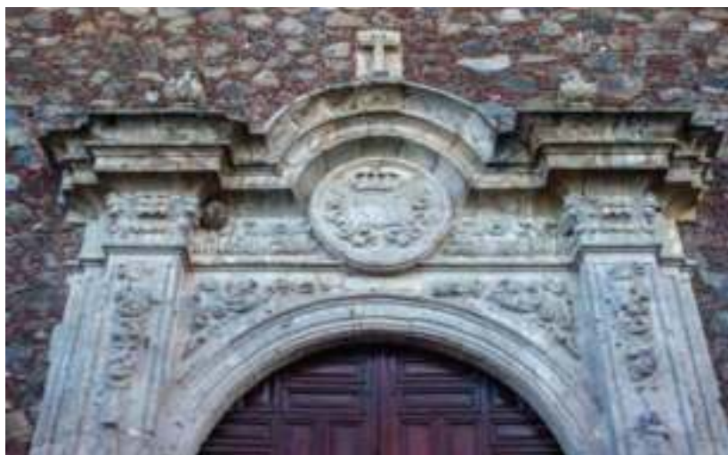
Portada del templo y convento de las capuchinas.

La construcción se ubica en el barrio de San Juan, con trazo y diseño original a cargo de Joaquín de Heredia. En junio de 1798, se fundó el convento y unos días después ingresaron las primeras 10 novicias, que hacia finales de año sumaban treinta.