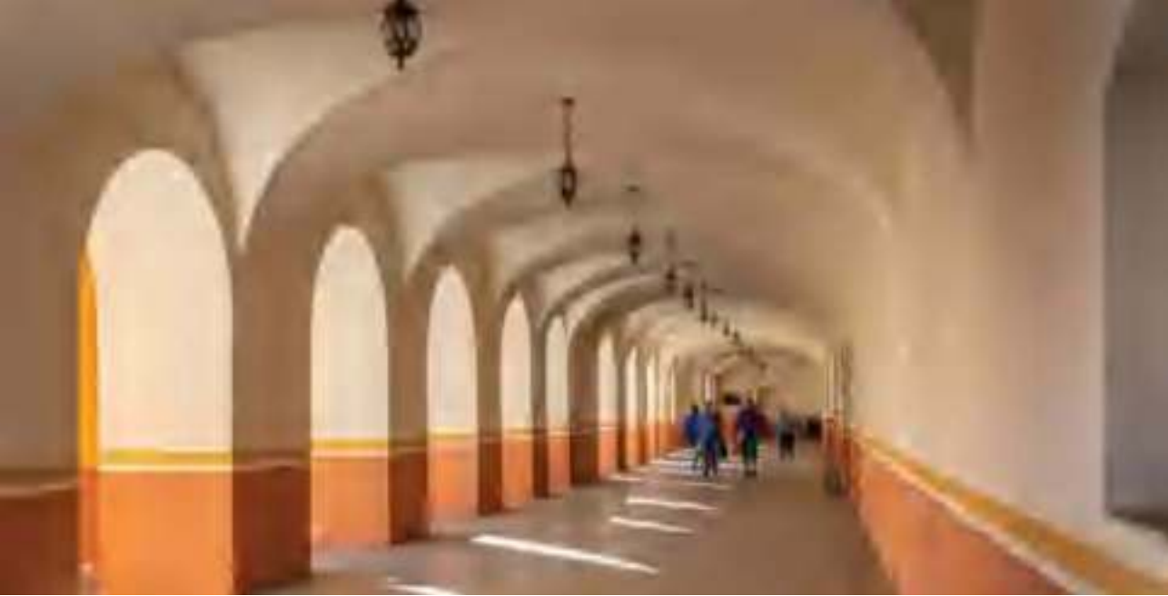
Los portales del Carmen.

parroquial y luego, nuevamente, como hospital —esta vez llamado San Vicente de Paul—; además, el terreno contiguo fue cementerio hasta la segunda década del siglo xx.