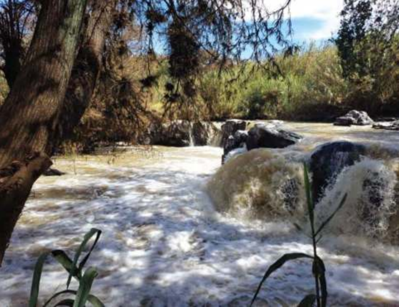
Río Lerma en Salvatierra.