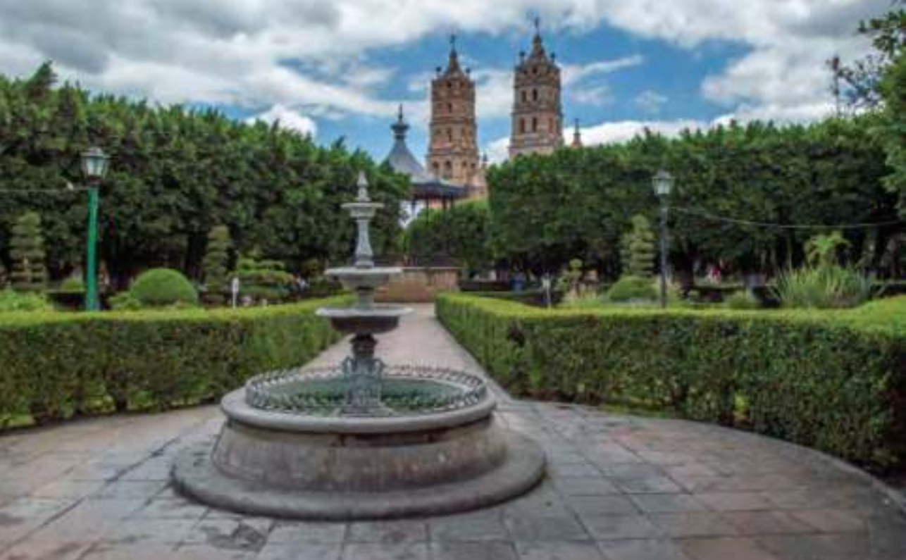
Santuario de Nuestra Señora de la Luz.

se aprecian óleos de los siglos XVIII y XIX, además de una bella y majestuosa imagen de la Virgen de las Luces, del siglo XVI, del artista purépecha Juan el Converso, perteneciente a la corte del rey Zintzicha en Pátzcuaro. La imagen fue llevada inicialmente a Acámbaro, como Nuestra Señora de la Purificación; luego el fraile Juan Lozano la trasladó al hospital de Guatzindeo, donde recibió el nombre de Nuestra Señora del Valle. La imagen es de pulpa de caña de maíz, sus ojos son de cristal café oscuro y mide 98 cm.