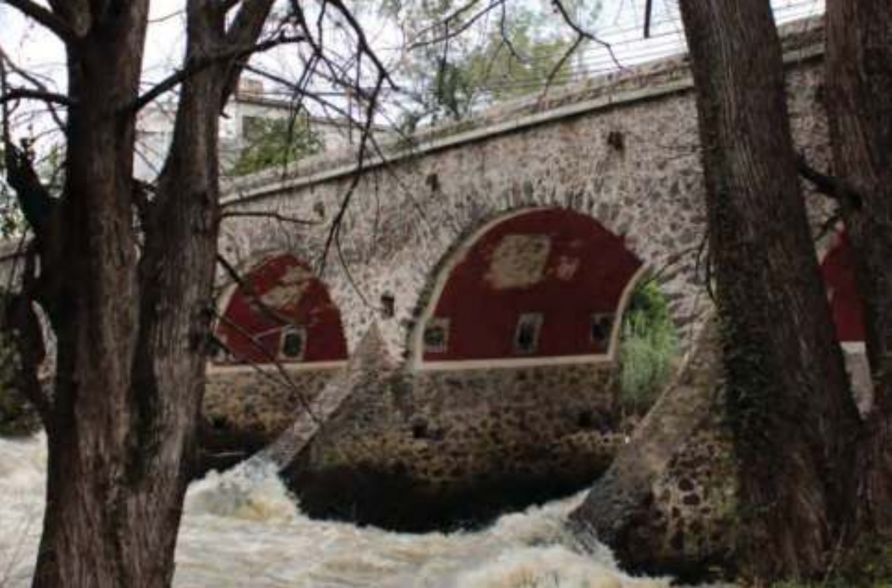
Puente de Batanes (Sector).