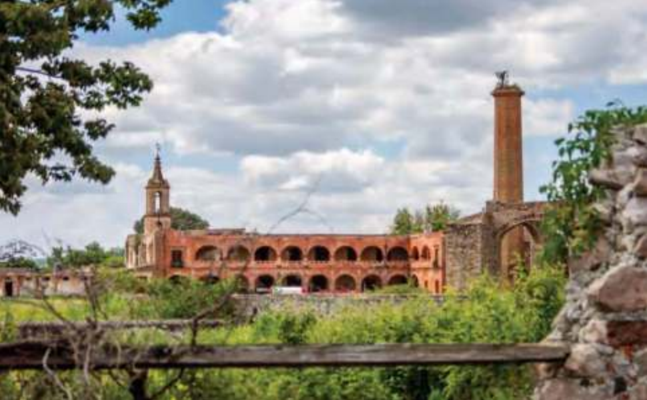
Exhacienda de San José del Carmen.

El Instituto Nacional de Antropología e Historia (INAH) describe las áreas de la hacienda: cochera, sacristía, calpanería, despacho, troje, tienda de raya, almacén, cocina y comedor. La entrada principal del antiguo casco está orientada hacia el norte, con columnas de fuste cuadrado y el escudo de la orden de los carmelitas.