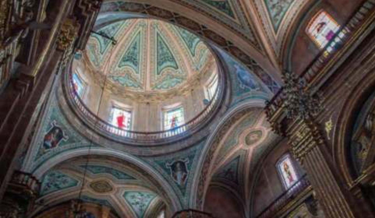
Vista interior de la cúpula principal del santuario de Nuestra Señora de la Luz.