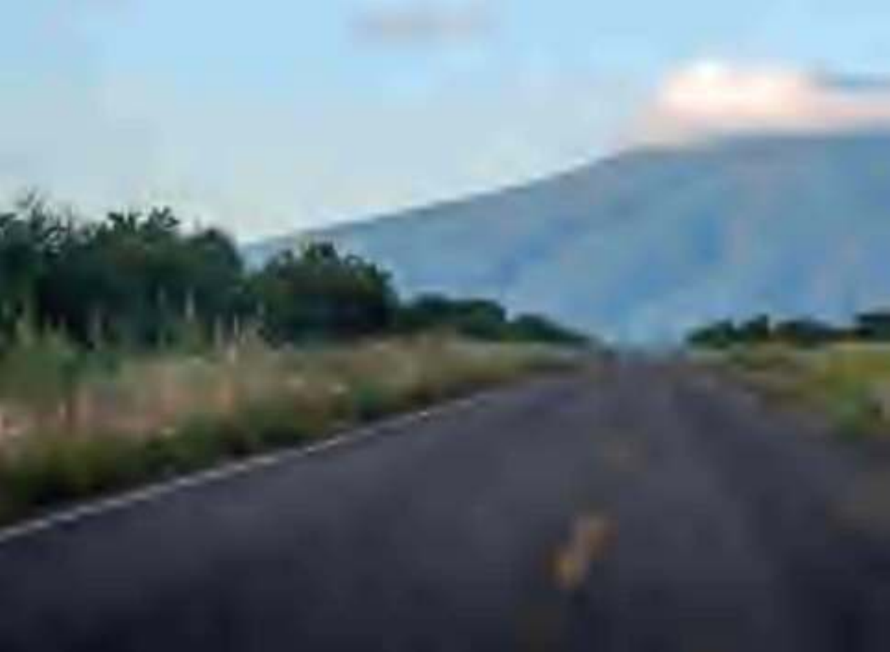
Cerro del Culiacán.

Laguna y conventos. La historia de Yuriria y Salvatierra está unida con los indios que habitaban el valle, por ello la ruta combina esas particularidades y esos hechos históricos.