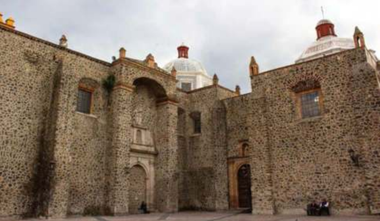
Templo y Convento del Carmen.

de la armonía y la proporción de las formas arquitectónicas coincidente con el pensamiento de los místicos de la época. De ahí que la edificación en Saltillo incluyera materiales de la región por su bajo costo, como tezontle y ladrillo, y en la fachada cantera labrada.