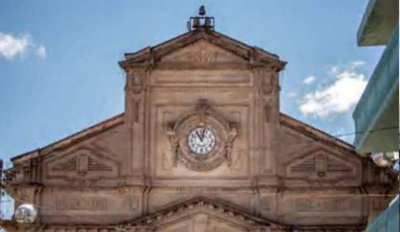
Portada principal del Mercado Hidalgo.