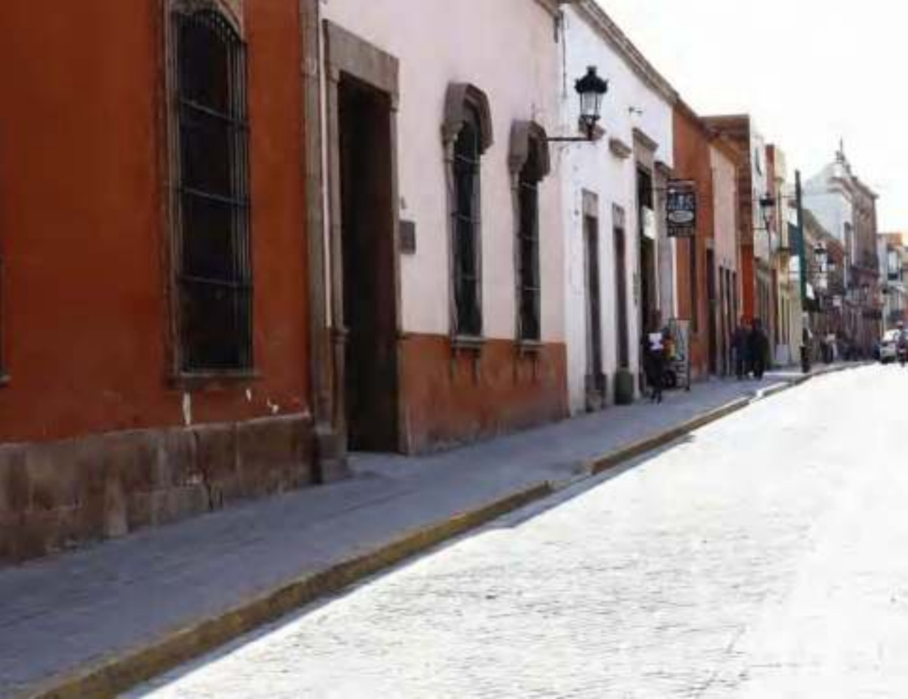
Ciudad de Salvatierra.

asadores de carne, juegos infantiles y espacios de recreación. La entrada es gratuita.