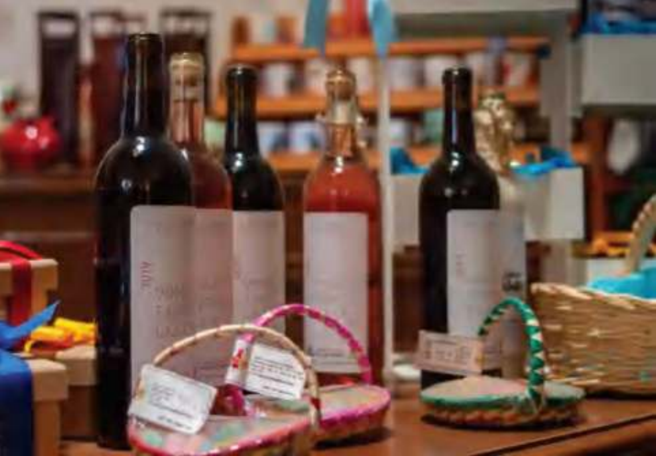
Vinos producidos en Salvatierra.

Viñedo y emparrado Las Maravillas tiene seis años de creado y está ubicado en la comunidad de La Quemada. Ahí se siembran las especies Flame, Ruby y Palomino, con las cuales se produce un vino delicioso. En el viñedo se puede disfrutar de bellos paseos y de la vendimia.