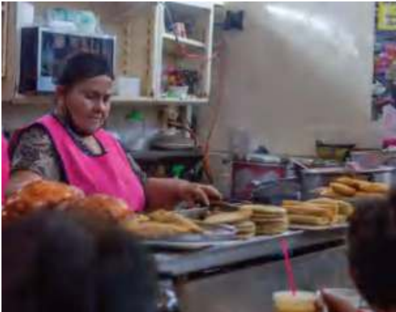
Cocinera en el mercado Hidalgo.

Se realiza en junio, en el Jardín Principal, para difundir las riquezas culinarias de la región. En él participan cocineras tradicionales y estudiantes de gastronomía.