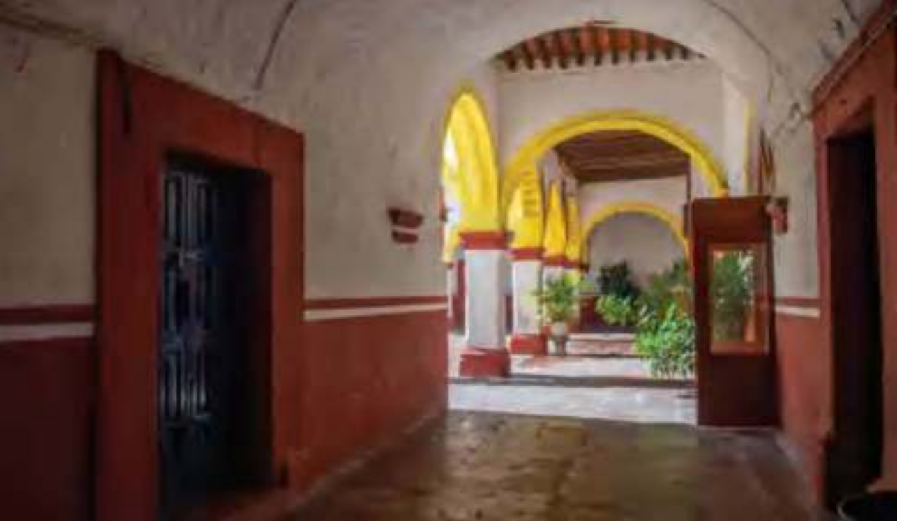
Convento de las capuchinas.

Santo Tomás, San Nicolás de la Condesa, San Nicolás de los Agustinos y San José del Carmen, por mencionar algunas.