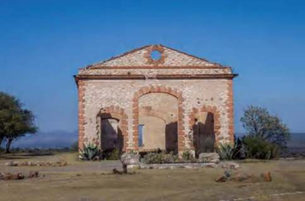
Edificación que resguardaba el malacate, mina San Rafael.

En el caso de la mina de San Rafael se pueden observar túneles inconclusos y con marcas que señalizan dónde había oro y plata. Y de la Mina de San Baldomero puede decirse que en la galera se localizaba la maquinaria para la molienda, su cubierta era una estructura metálica y lámina de zinc; además, el tiro de la mina tenía una estructura metálica de aproximadamente 20 metros y se le llamaba El Castillo.