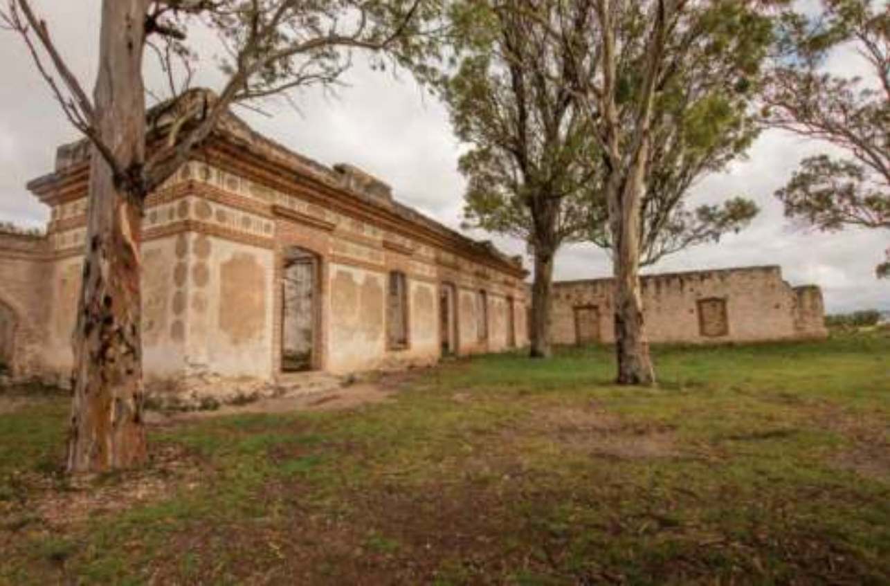
Vista de la Mina El Triángulo.

mitad del XIX que se constituyó la Compañía Minera El Triángulo de la Trinidad, con capital extranjero, quedando conformada como Sociedad Anónima el 28 de junio de 1895. De sus vetas se extraían, principalmente, oro y plata. Pese al abandono y la destrucción de la edificación de la hacienda, aún conserva la soberbia y solidez arquitectónica. Actualmente se pueden visitar los vestigios de esta mina y la hacienda, así como los restos de la construcción donde estaba el malacate junto al tiro de la mina, e incluso puede descenderse a ésta y conocer los túneles.