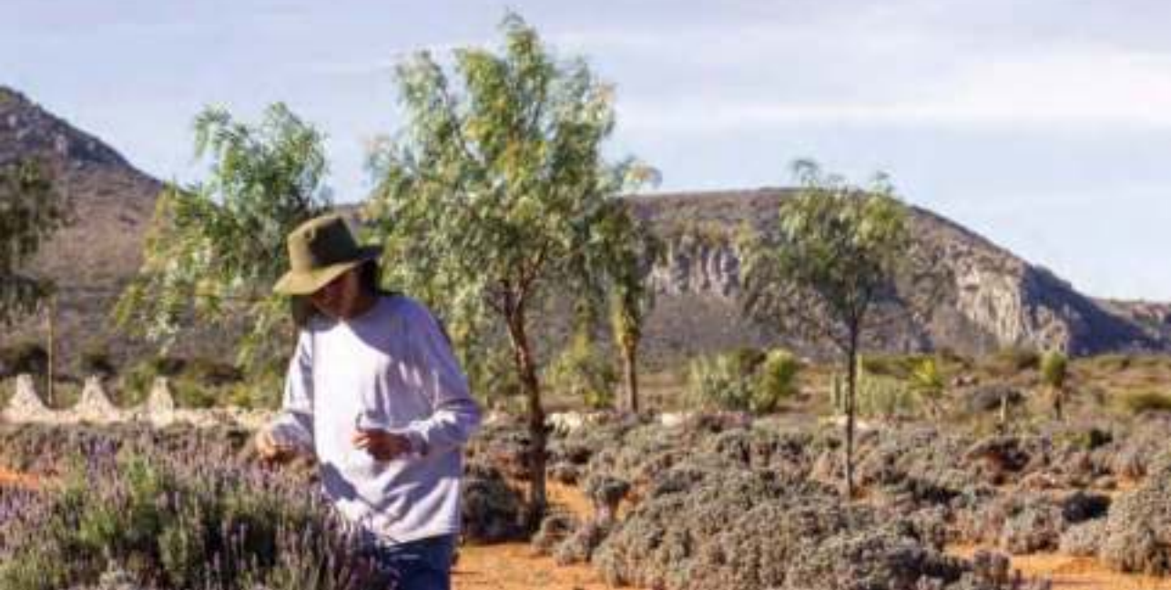
Campos de lavanda.

aventura, el senderismo, el ciclismo de montaña y los paseos a caballo. Ahí también, se puede recorrer las minas, las haciendas y subir el cerro del Águila o el cerro Pelón, así como realizar observaciones de aves y exploraciones botánicas.