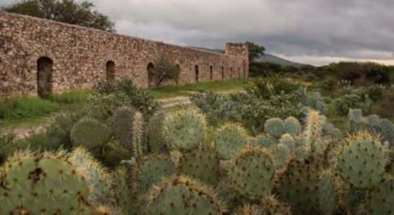
Mina de Santa Brígida.

Después de 60 años de luchas, la corona española formalizó por Real Cédula, una misión jesuita para la evangelización de estos pueblos originarios; así que se fundó el primer colegio religioso. Con la llegada de misioneros se dejó de lado los presidios y se creó un nuevo núcleo poblacional en 1590. Y hacia 1595 se inició la construcción de los hornos de Santa Brígida y la explotación de las vetas de oro y plata, además del mercurio.