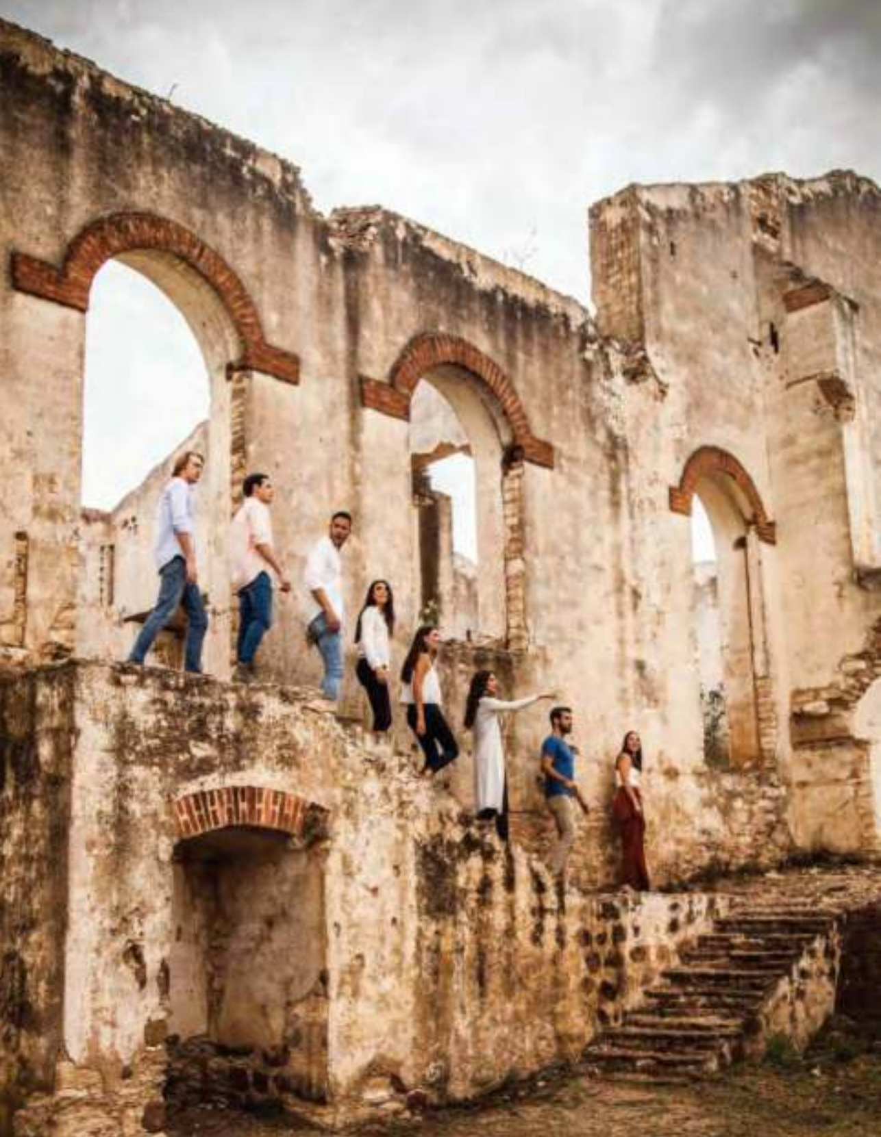
Recorrido por minas.