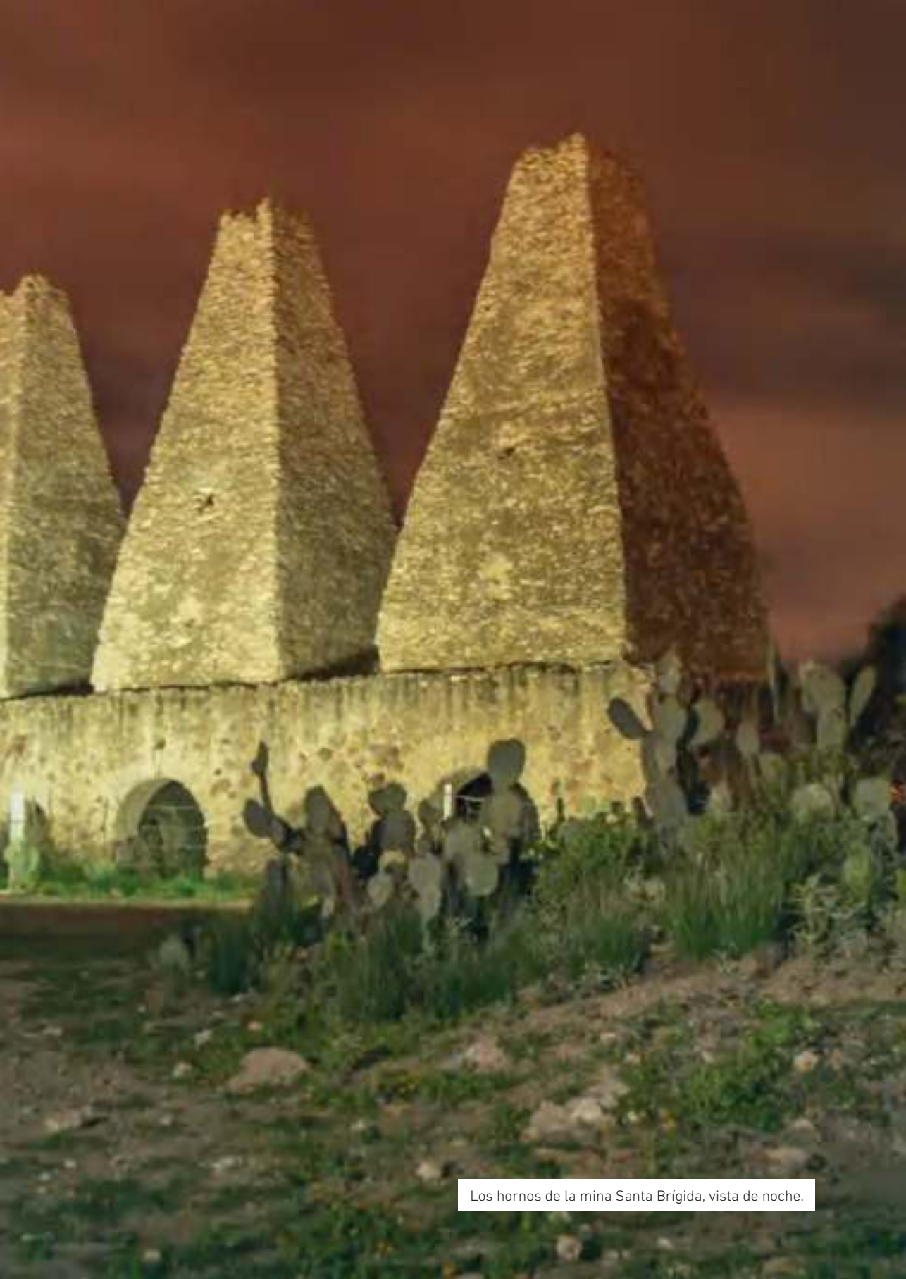
Los hornos de la mina Santa Brígida, vista de noche.