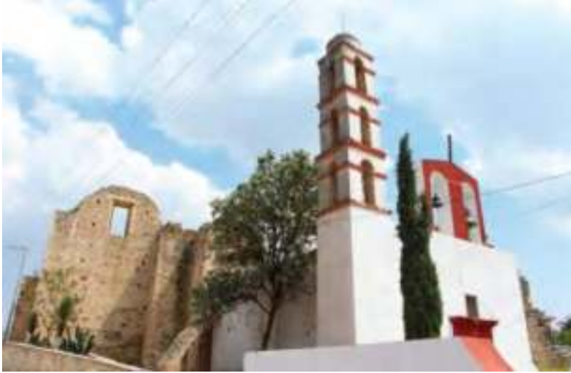
Capilla del Señor de los Trabajos.

Trabajos, construyendo un templo con piedra caliche y ladrillo, sin embargo, quedó inconcluso ante el derrumbe del sector y el movimiento de la Revolución Mexicana.