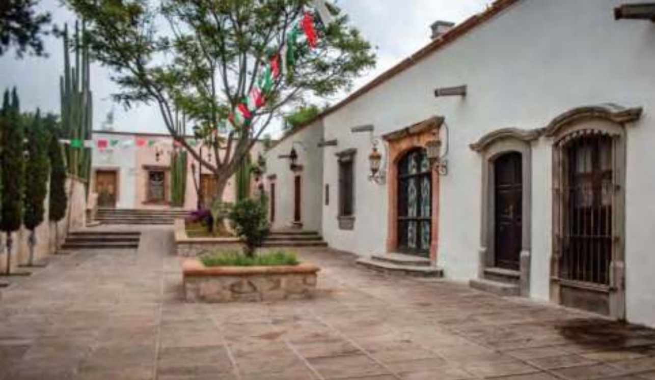
Vista del Jardín Principal o Juárez.

lunetos. Se destaca por sus columnas compuestas y el uso de cantera. En sus interiores aún se preservan frescos semejantes a mosaicos y otros detalles decorativos. De portada recubierta y sobria, con aplanados a base de cal y arena de caliche.