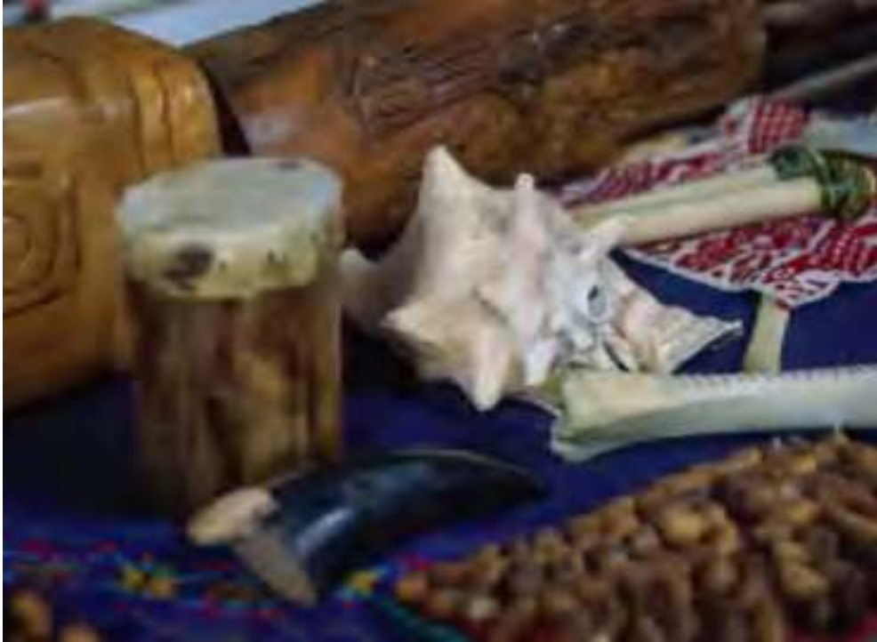
Instrumentos musicales de inspiración prehispánica, elaborados en Mineral de Pozos.