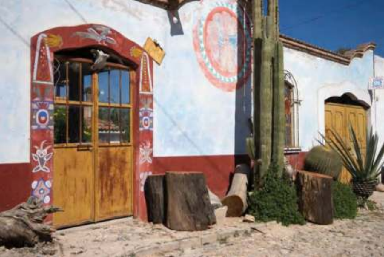
Mineral de Pozos.