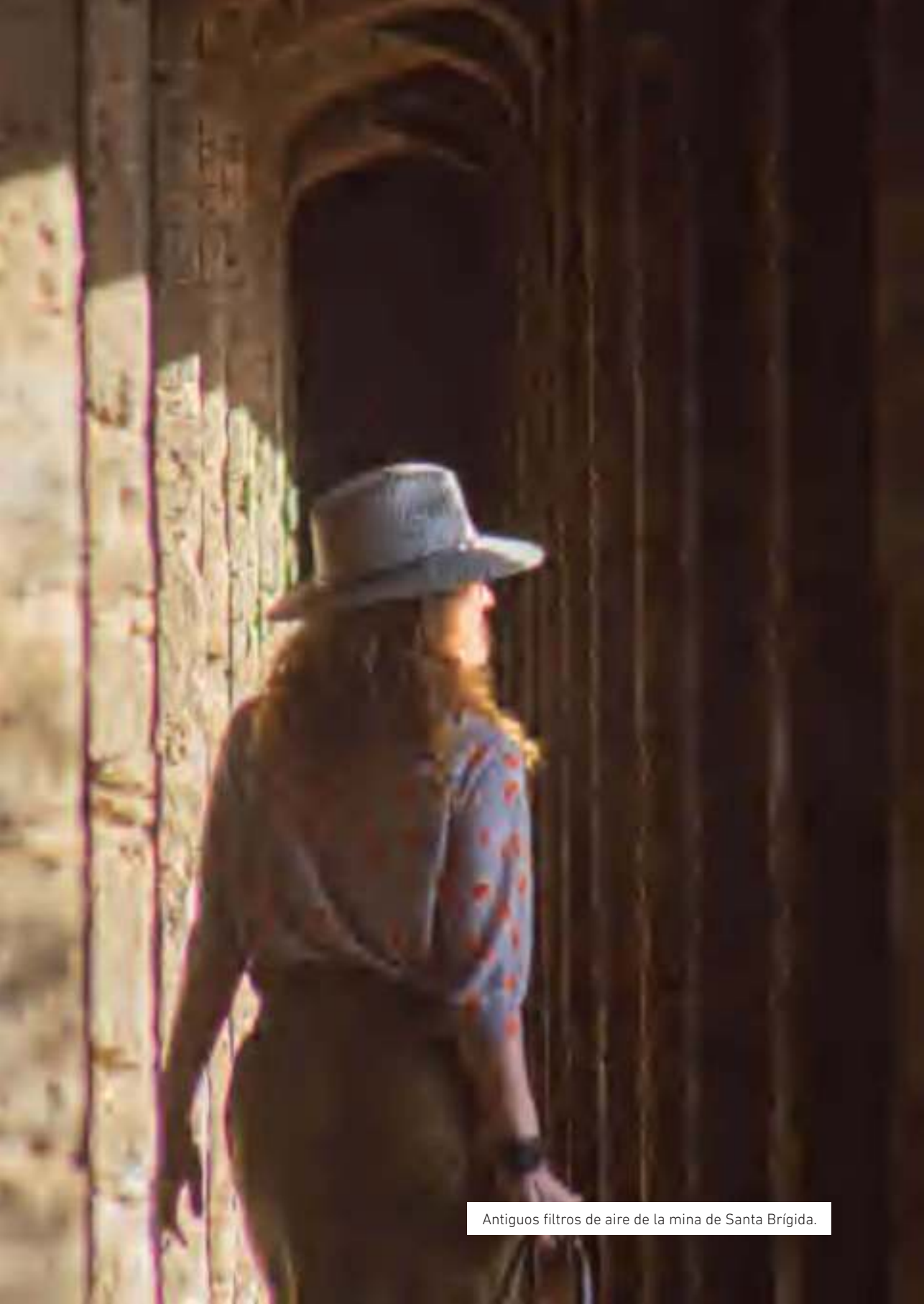
Antiguos filtros de aire de la mina de Santa Brígida.