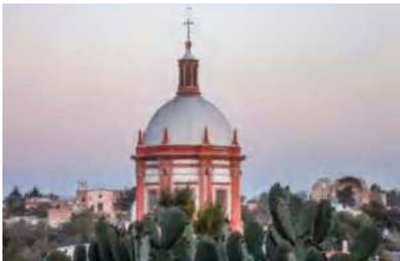
Cúpula de la parroquia de San Pedro Apóstol.