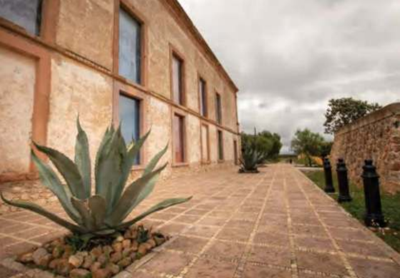
Exterior de la Antigua Escuela Modelo, edificio restaurado como espacio cultural.

chichimeca, la evangelización jesuita y las dos épocas de gran bonanza minera: la colonial y el Porfiriato.