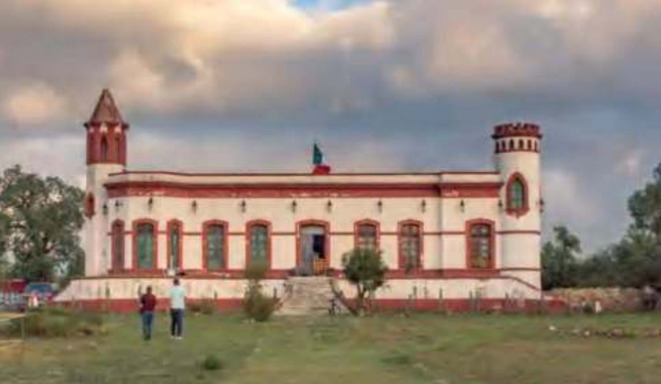
Hacienda Santa Brígida.

estilo militar, con una remodelación que data de finales del siglo XIX. Fue rica en oro, plata, plomo, zinc, cobre y mercurio. Tenía 11 niveles y formaba parte de la hacienda.