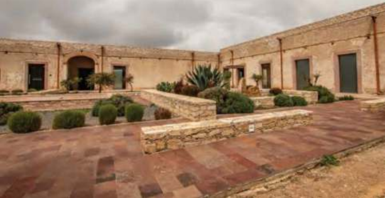
Patio de la Escuela de Niñas de la restaurada Antigua Escuela Modelo.

En la plaza Zaragoza, se encuentra la Antigua Presidencia Municipal que conserva un reloj suizo en funciones, y comenzó su construcción el 16 de septiembre de 1895 para concluir el año siguiente.