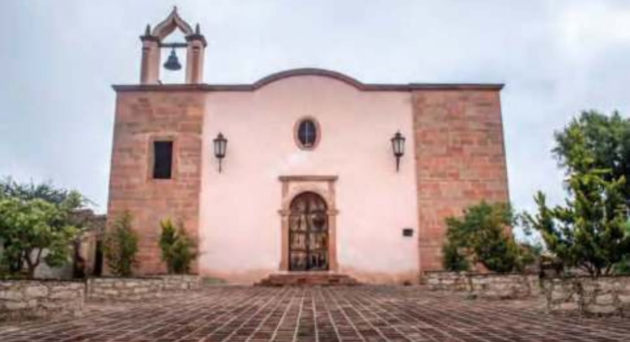
Capilla de San Antonio de Padua.

aprecia el uso de cantera y de detalles de pintura originales. Se estima que en algún momento fue ocupada como granero, aunque hoy se encuentra abandonado.