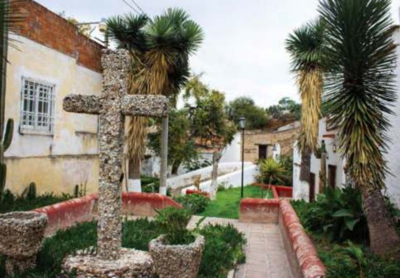
Rumbo al Puente de la Constitución.

para convertirla en un espacio para el desarrollo de las artes con salas de exposiciones, una biblioteca y un centro de documentación.