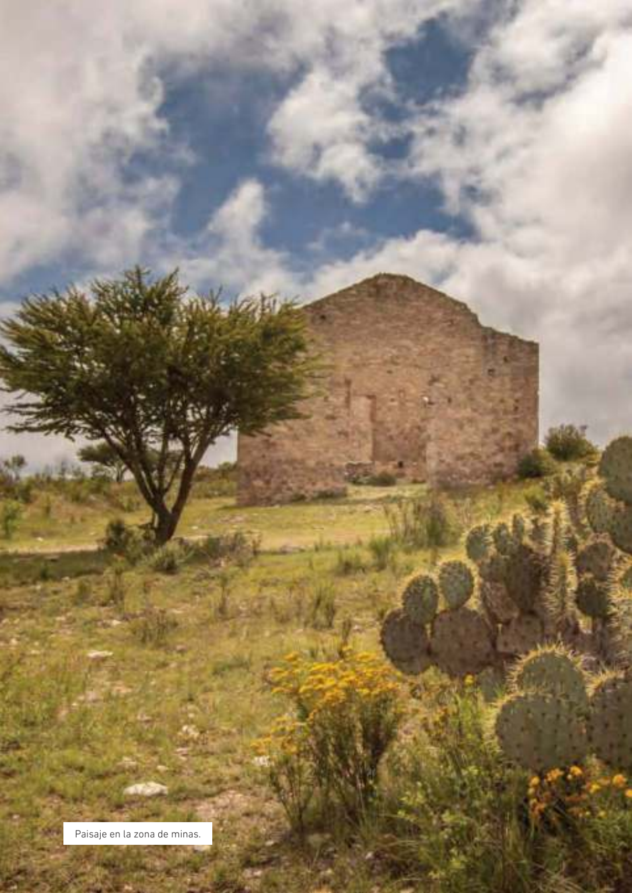
Paisaje en la zona de minas.