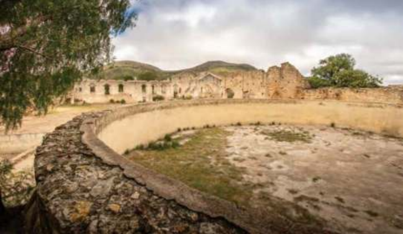
Vestigios de la mina Cinco Señores.

Lucía y Guadalupe. La hacienda fue construida con caliche y ladrillo y es una de las más grandes de la región de Mineral de Pozos. Su mina contaba con dos tiros: uno llamado San Agustín y el otro Santa María. Cabe señalar que, desde el descubrimiento de las minas, se adoptó como tradición entre los mineros darle un nombre a los tiros, ya sea de hendidura para el descenso o como prolongación a otros niveles.