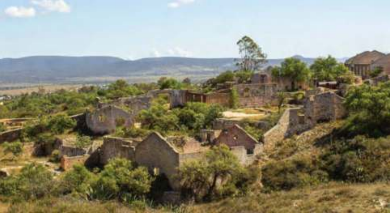
Vestigios de la Mina Cinco Señores.

En 1767, una importante cantidad de haciendas, ranchos, molinos e ingenios eran propiedad de los jesuitas, como Los Lobos, Santa Anita y la Manzanares, por lo que su expulsión provocó que los pobladores trataran de impedir su salida y cayera la productividad minera.