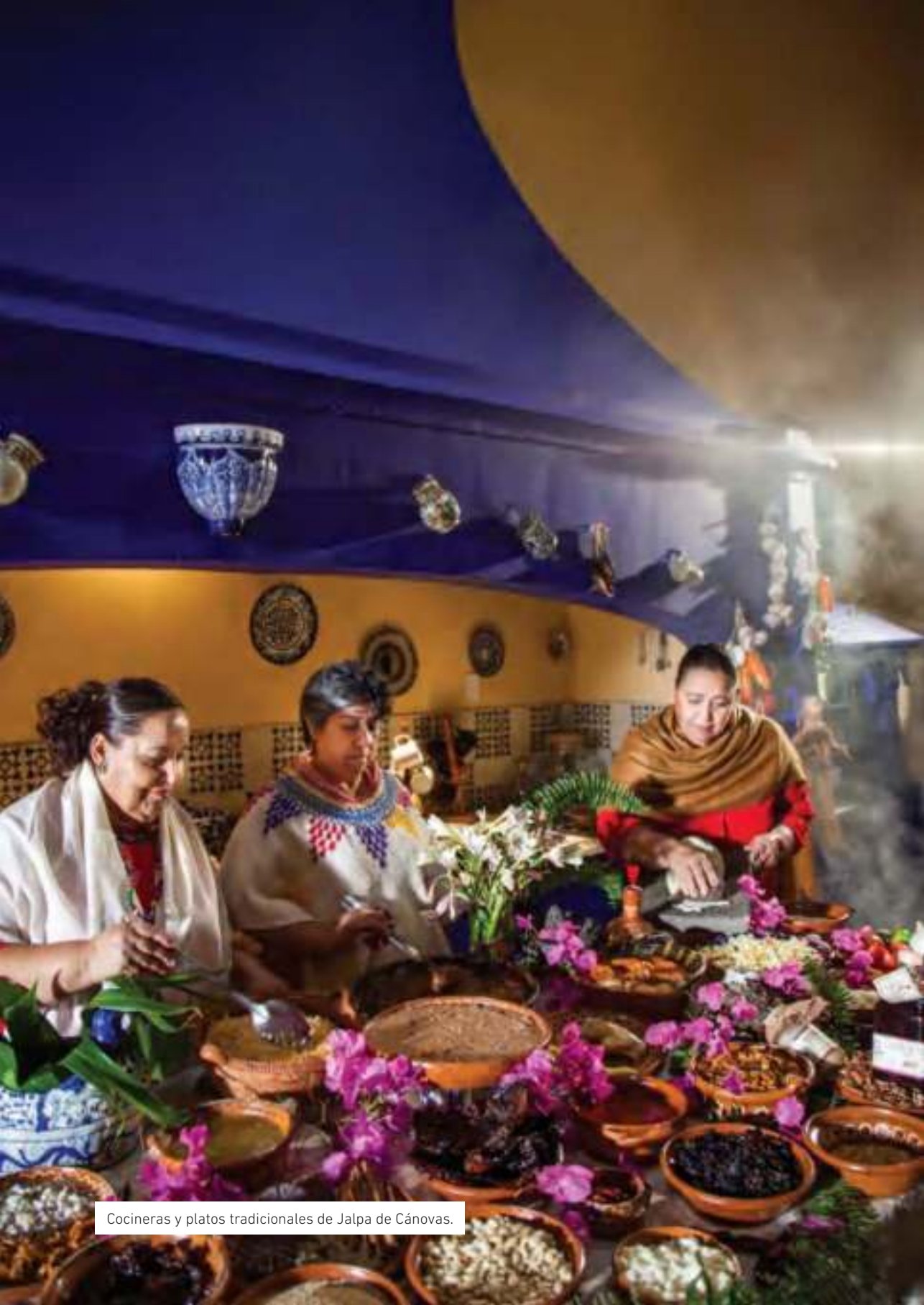
Cocineras y platos tradicionales de Jalpa de Cánovas.