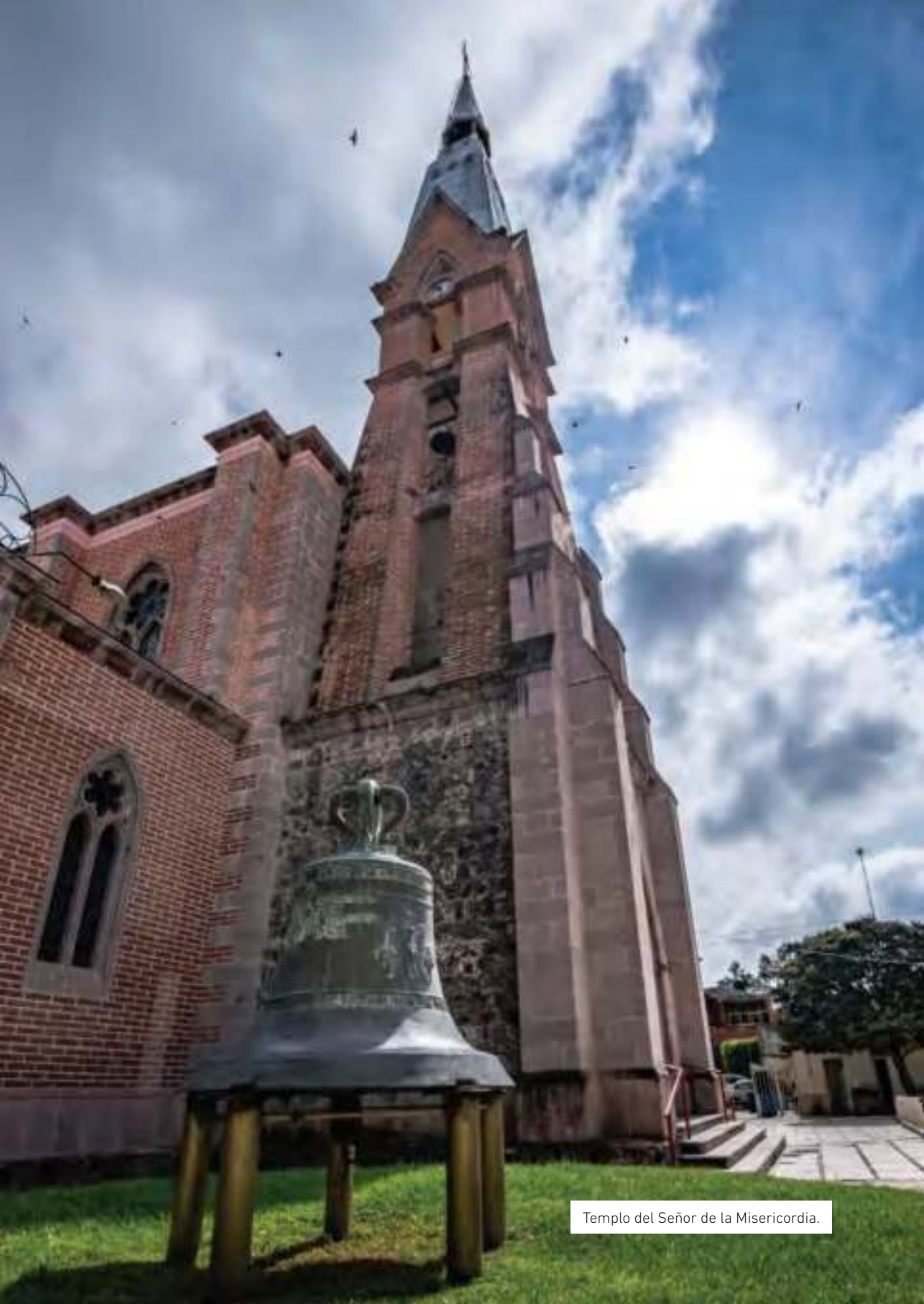
Templo del Señor de la Misericordia.