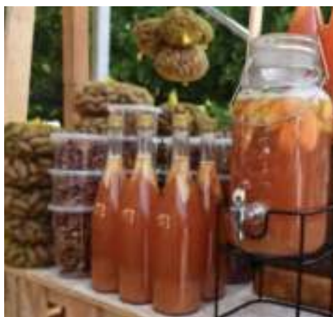
Bebidas, conservas y nueces.

Esta feria es un espacio de degustación de platillos, conservas, ates y bebidas con base en la nuez y el membrillo; así como un encuentro entre productores, cocineras y cocineros tradicionales, y artesanos. Además, es posible visitar las nogaleras y los cultivos de membrillo.