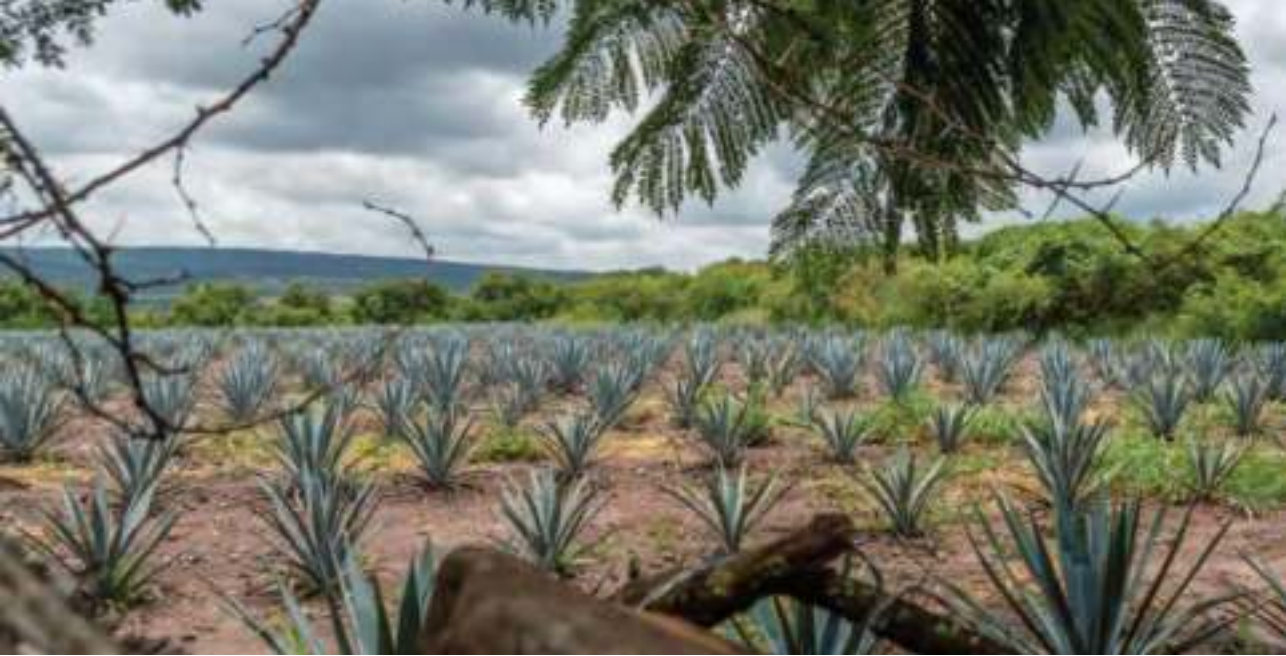
Paísaje agavero de los Pueblos del Rincón.