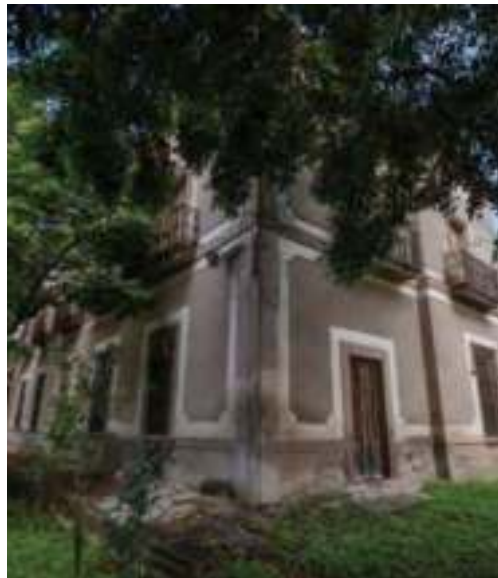
Parte de la antigua hacienda de Cánovas.

Actualmente, la hacienda está abierta al público para eventos y visitas guiadas. En la casa grande están algunos de los muebles originales del comedor y la recámara, principalmente. Además, se tiene una vista privilegiada del pueblo. El casco también conserva el molino y el acueducto, además de vestigios de las trojes y la tienda de raya. En las bodegas del siglo XIX, se puede observar