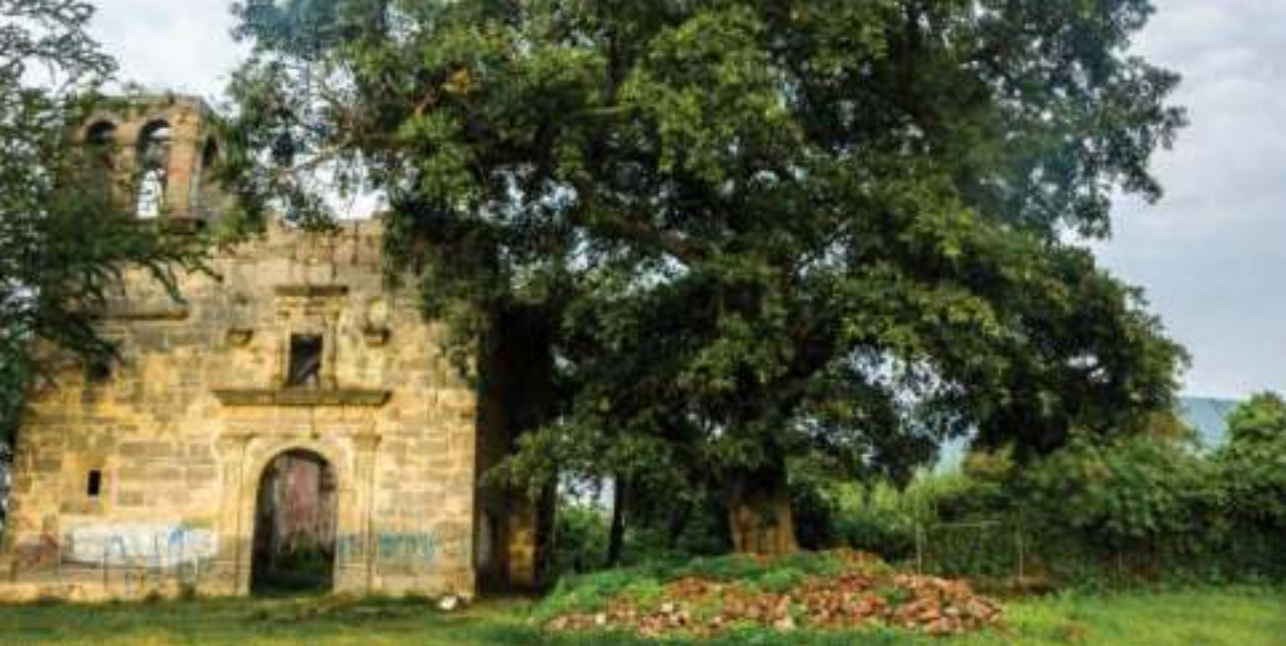
Antiguo templo de San Gaspar, en Atotonilquillo.