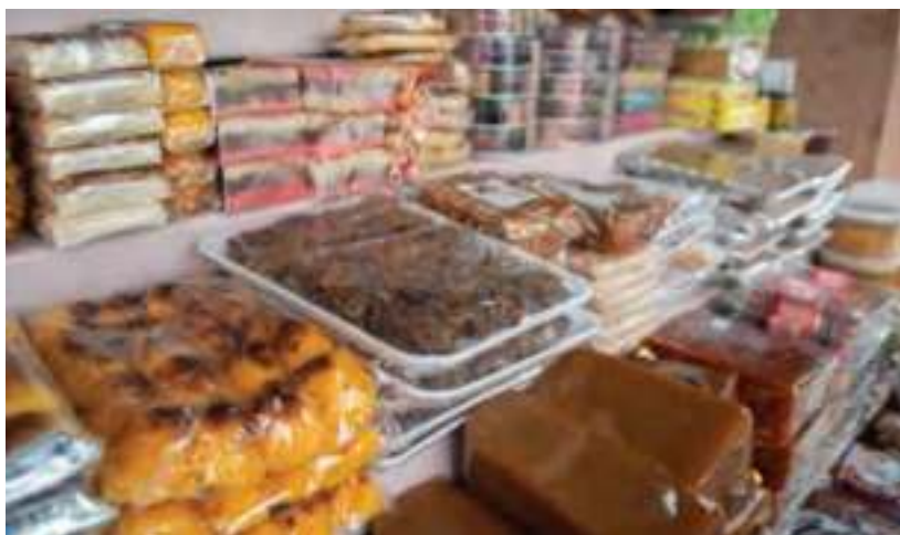
Dulcería tradicional de la región.

horas. Filtre el puré con tamiz o cedazo, para obtener todo su jugo, y viértalo en un cazo de cobre profundo con el azúcar y dos tazas de agua. Cocine a fuego lento de 20 a 30 minutos, moviendo constantemente con una pala o cuchara de madera, hasta que el azúcar se disuelva y adquiera un color de caramelo. La fruta restante viértala en una olla con cuatro tazas de agua y cocínela a fuego medio. Cuando esté tierna, muélala hasta obtener un puré. Viértalo en el cazo de cobre y mezcle perfectamente. Regrese el recipiente al fuego y continúe la cocción por 25 minutos, cuidando que no se pegue la mezcla. Retire del fuego al espesar y vierta en moldes. Deje secar, desmolde y conserve en un lugar fresco y seco.