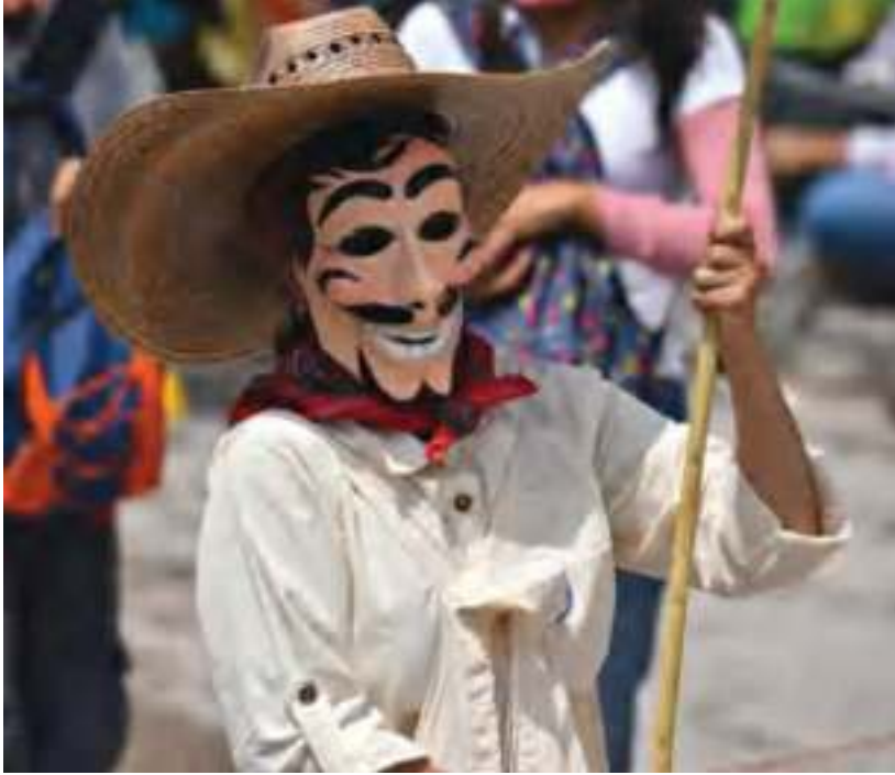
Festejos con máscaras artesanales.

La Judea es un ritual en el que se escenifica el juicio y la muerte de Judas, personaje bíblico que traiciona al Nazareno. Participan más de quinientas personas, entre músicos y actores personificando a los soldados romanos y judíos. Se hacen representaciones de la procesión, la bendición de ramos, la procesión del Agua de Azahar, la sentencia, las tres caídas, el ahorcamiento de Judas, así como la Procesión del Silencio.