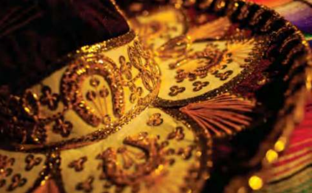
Detalle de un tradicional sombrero de charro.

hasta que los tejidos fueron adoptando nuevos materiales como las fibras sintéticas.