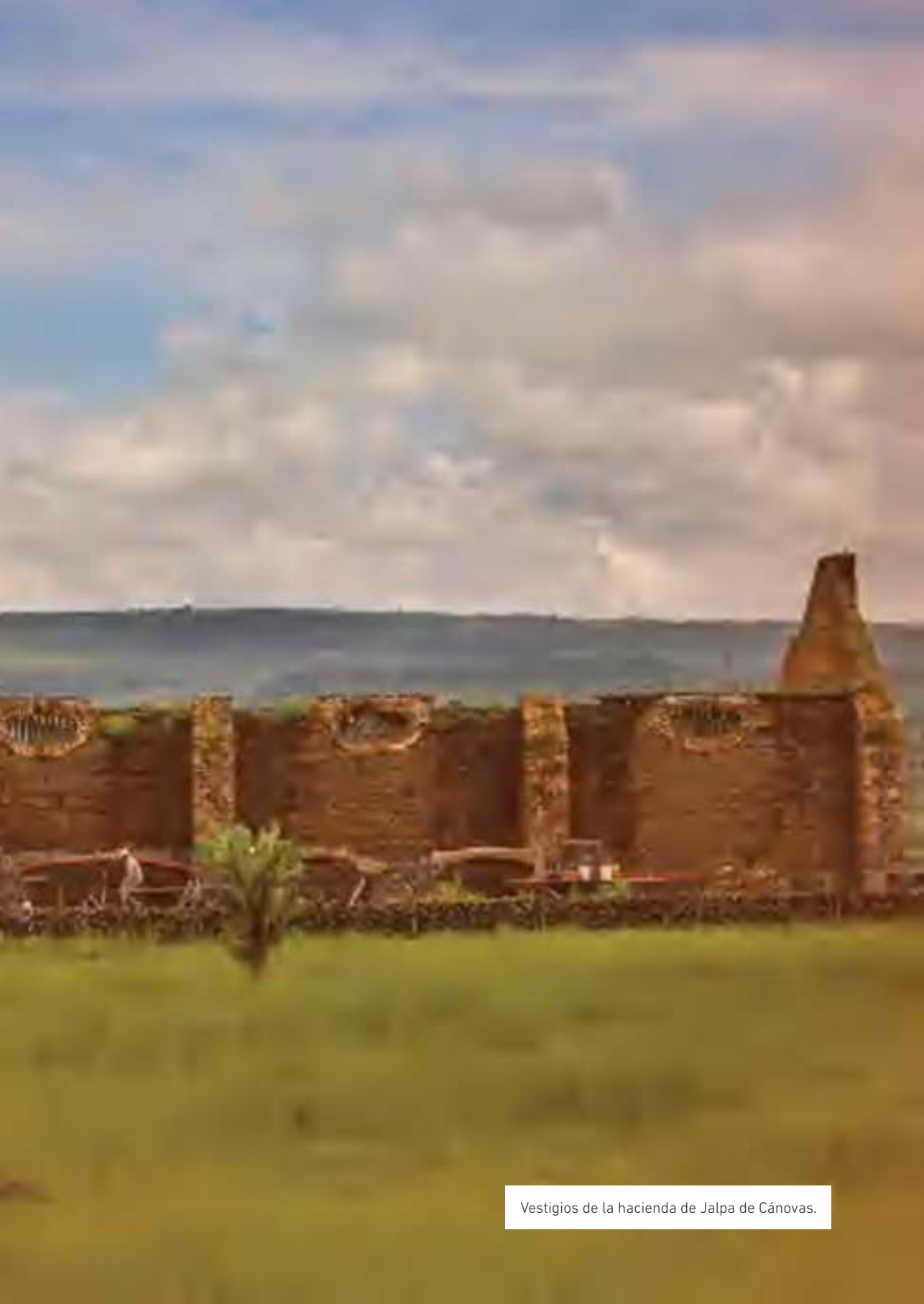
Vestigios de la hacienda de Jalpa de Cánovas.