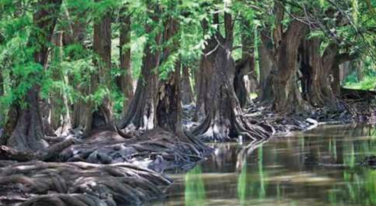
Sabinos en el bucólico paraje de las Musas (Sector).