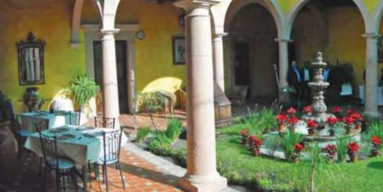
Hacienda Cañada de Negros.

su principal fuente de desarrollo fueron los cultivos de trigo y la crianza de ganado menor.