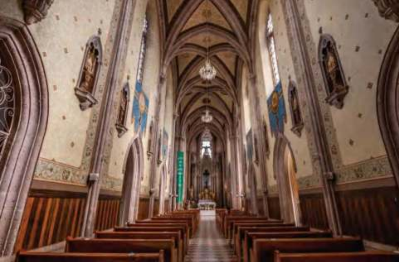
Interior del templo del Señor de la Misericordia.

de personas, principalmente jóvenes, para participar en un juego de adivinanzas en el que se debe encontrar, en la mano del contrincante, un coquito de aceite.