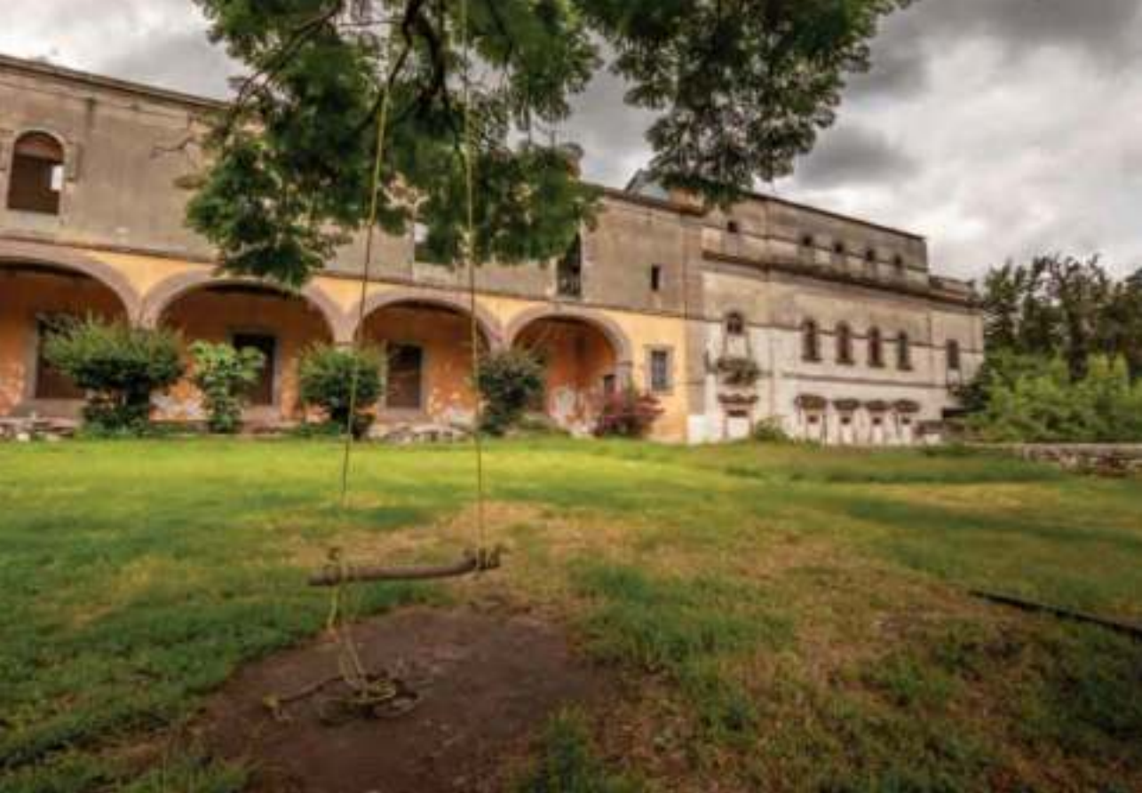
El molino viejo de la Hacienda de Cánovas.

De gran patrimonio arquitectónico con un paisaje natural envidiable, Jalpa de Cánovas es perfecto para degustar la comida tradicional del estado, como las patitas de puerco entomatadas.