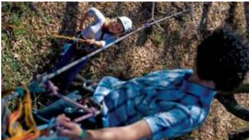
Práctica de rappel , una excelente opción para el turismo de aventura.

Se distingue por su diversidad biológica, sus paisajes y manantiales. Entre su fauna hay coyotes, zorros, tejones, zorrillos, anfibios, reptiles, aves migratorias y residentes. Es un lugar privilegiado para el ecoturismo y los deportes de aventura. Una de las opciones más atractivas es el senderismo, así como el vuelo de ala delta, cuya práctica se recomienda en mayo y octubre.