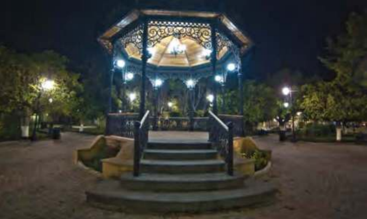
Noche en Jalpa de Cánovas.

las seis aperturas de puertas coronadas por arcos escazanos; así como los silos de piedra, que datan del siglo XVIII. Otro de los atractivos que se mantiene es el jardín de estilo europeo. Destaca, también, el santuario de Guadalupe, construido en el siglo XVIII, así como las huertas de nuez.