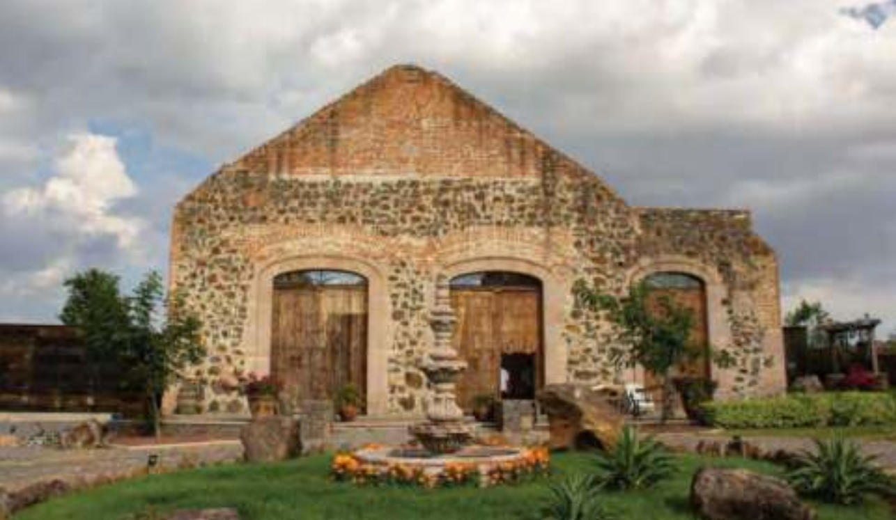
Jalpa de Cánovas, una tierra de haciendas.

San Pedro Piedra Gorda, cuyo Santo Patrono es Nuestro Padre Jesús Nazareno, que data del siglo XVIII; además del reloj británico de 1860.