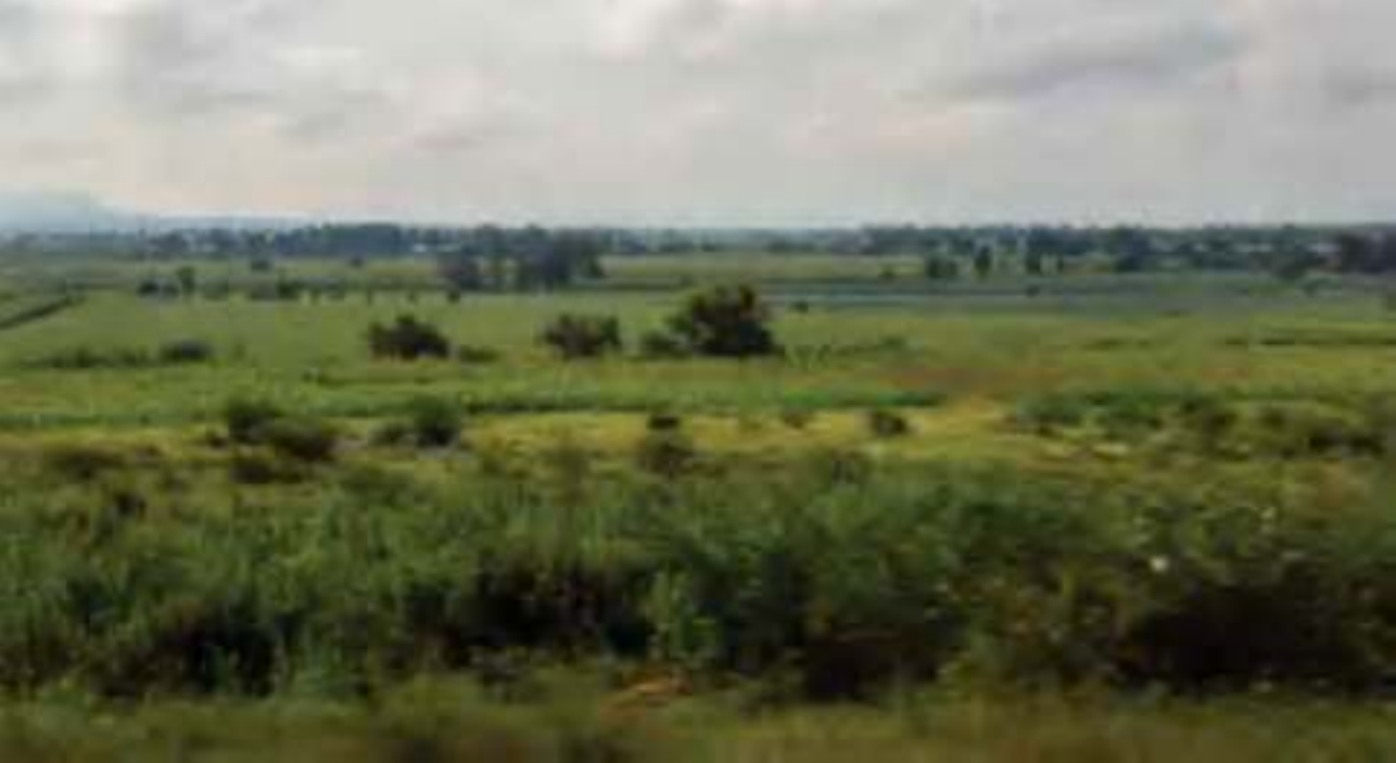
Panorámica de los campos de Jalpa de Cánovas.