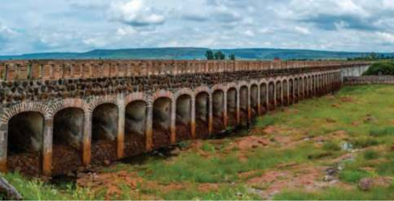
La presa nueva o de Santa Efigenia,.

mayor a los 50 mil metros cúbicos. Es una obra de Luis Long, de 24 metros de altura y 457 metros de largo, compuesta por varios arcos y ubicada entre dos montañas.