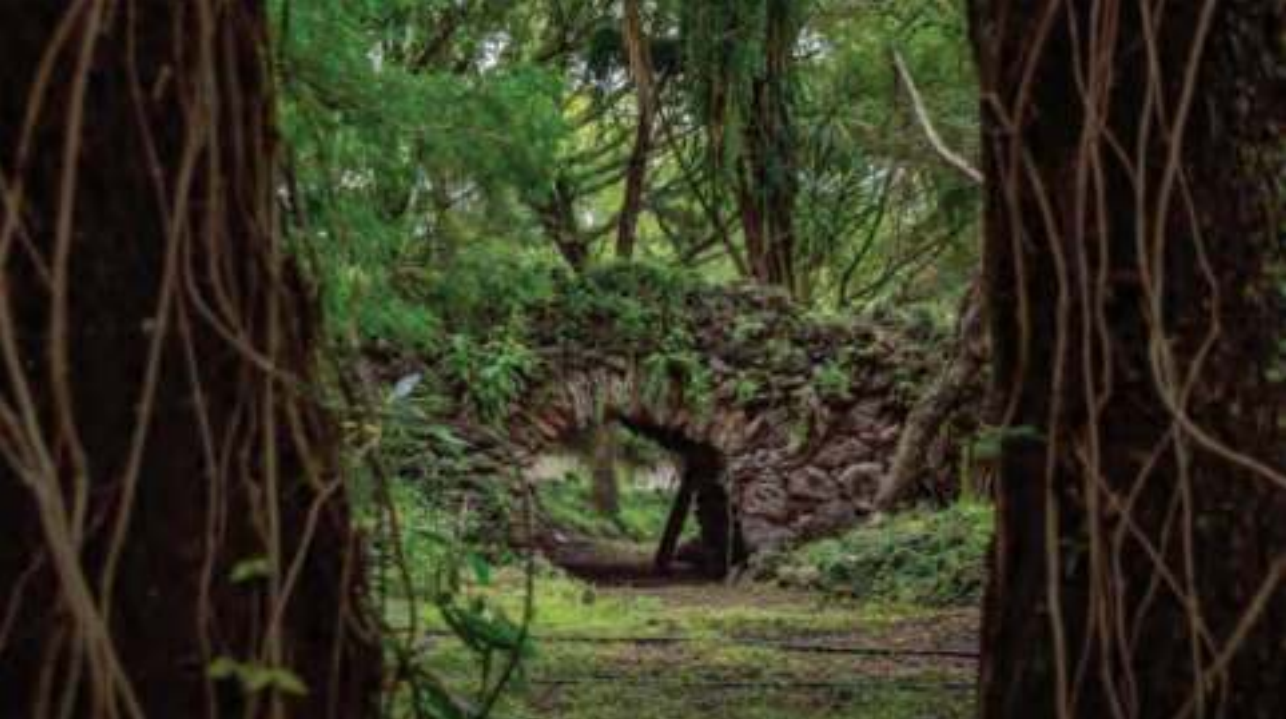
Las huertas de nuez, elemento distintivo de Jalpa.

caballerías de tierra, en la Villa de Lagos. Fue en el siglo xvii cuando ésta prosperó y comenzó a cambiar de dueños, hasta que, a mediados del siglo xix, la adquirió Manuel Cánovas para llevarla a su mayor auge agrícola y ganadero.